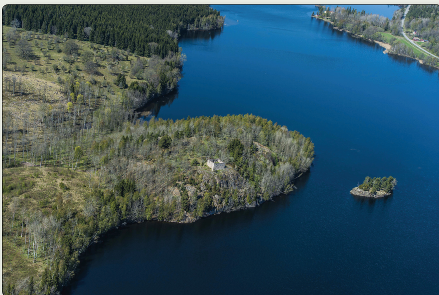
Brahälla slotsruin vid sjön Noen.

N 6427930 / E 483781 (SWEREF 99 TM) // N 57° 59' 33,70", E 14° 43' 32,40" (WGS84)