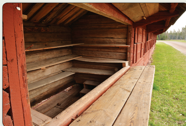
En av bodarna med hyllinredning.

Marknadsbodarna används fortfarande vid den flitigt besökta marknaden som hålls den första torsdagen i september varje år. På bodlängans västra gavel finns en platta, som visar att bodarna förklarats för byggnadsminne och är skyddade.