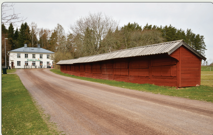
Marknadsbodarna i Adelöv, bevarade från 1700- eller 1800-talen, består av en långa med tolv bodar.

N 6430345 / E 480409 (SWEREF 99 TM). N 58° 0' 51,31", E 14° 40' 6,32" (WGS84)