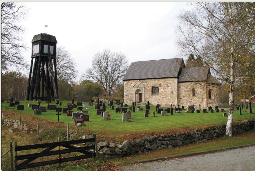
Hjälmseryds gamla kyrka.

N 6351751 / E 470655 (SWEREF 99 TM) // N 57° 18' 27,96", E 14° 30' 46,49" (WGS84)