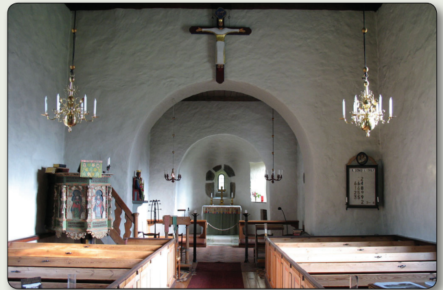
Kyrkans interiör.

Tre meter väster om västingången finns ett löst stenblock med hållristningar från bronsåldern – tre koncentriska cirklar och i mitten en skålgrop. I stenens nederkant finns en antydan till en skeppsfigur. På andra sidan vägen ligger ett gravfält från yngre järnålder.