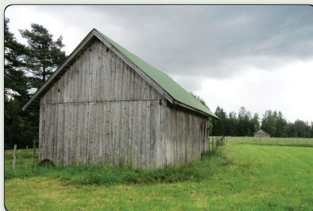
Ängslada med regelstomme och stående panel.

I Rommen finns två olika typer av ängslador. Den äldsta typen är mindre och utgörs av en timrad stomme. Timret ligger glest för att lufta höet. Under de första decennierna på 1900-talet övergick man till att i stället uppföra ängslador med regelstomme, som försågs med stående panel utvändigt. Dessa lador är oftast större än de timrade. Det var också vanligt att man ordnade stora portar på båda långssidorna så att man kunde köra in i ladan, lasta av och sedan köra ut.