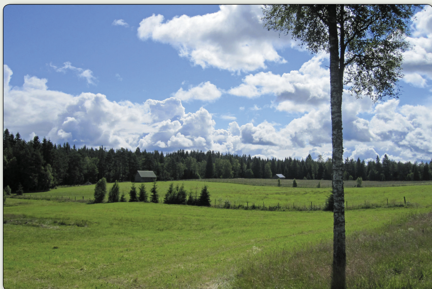
Ängslandskapet Rommen.

N 6387270 / E 470064 (SWEREF 99 TM) // N 57° 37' 45,294" // E 14° 29' 51,582" (WGS84)