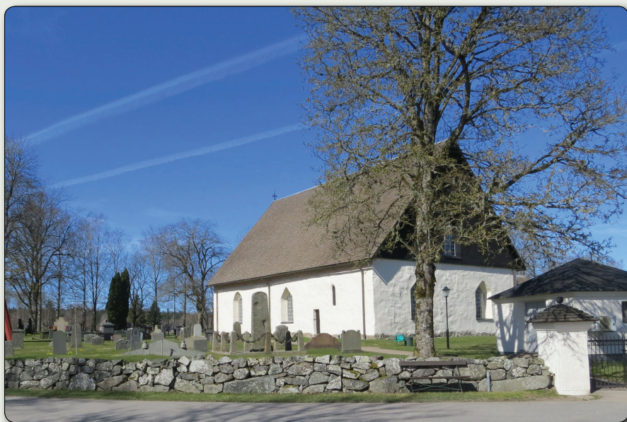
Norra Sandsjö kyrka.