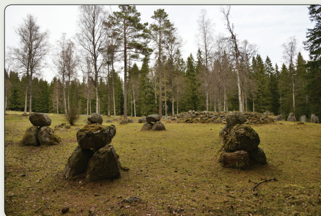
Fagertoftagravfältet. I förgrunden krets av järnåldersdösar.

Vid parkeringen intill gravfältet ligger den s.k. Midsommarkällan. För att hålla sig frist drack man eller tvättade man sig här under midsommarnatten. Använd gärna källan, men var försiktig med att "leka ting" vid domarringarna – en gammal sägen berättar att det gör dig sjuk.