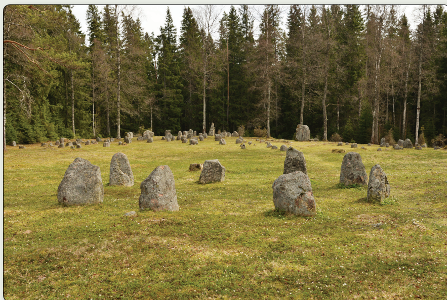
Fagertoftagravfältet. I förgrunden en domarring.

N 6394227 / E 484870 (SWEREF 99 TM)m // N 57° 41' 24,02", E 14° 44' 46,38" (WGS84)