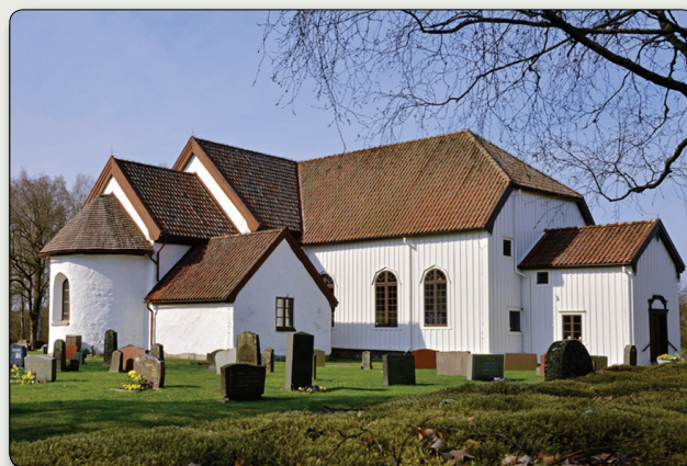
Medeltidskyrkan uppfördes av sten. När kyrkobesökarna på 1700-talet inte längre rymdes i den medeltida byggnaden för-sågs de med en tillbyggnad av trä mot norr.

Kyrkomiljön omfattar även klockstapeln, troligen från tidigt 1700-tal, och flera andra byggnader av olika ålder, vilka har kopplingar till kyrkan och platsens funktion som sockencentrum. Ett höggravfält från järnåldern med drygt 150 gravar ligger i den glesa skogsmarken på båda sidor om vägen i vägkorsningen mot Ase, när man närmar sig kyrkan söderifrån. Här kan man se både högar och stensättningar. I omgivningarna finns också gamla färdvägar, s.k. hålvägar, troligen från vikingatid. Bringetofta välbevarade kyrkby med omgivande fornlämningsmiljö kan sägas ingå i det medeltida folklandet Njudungs kärnbygd.