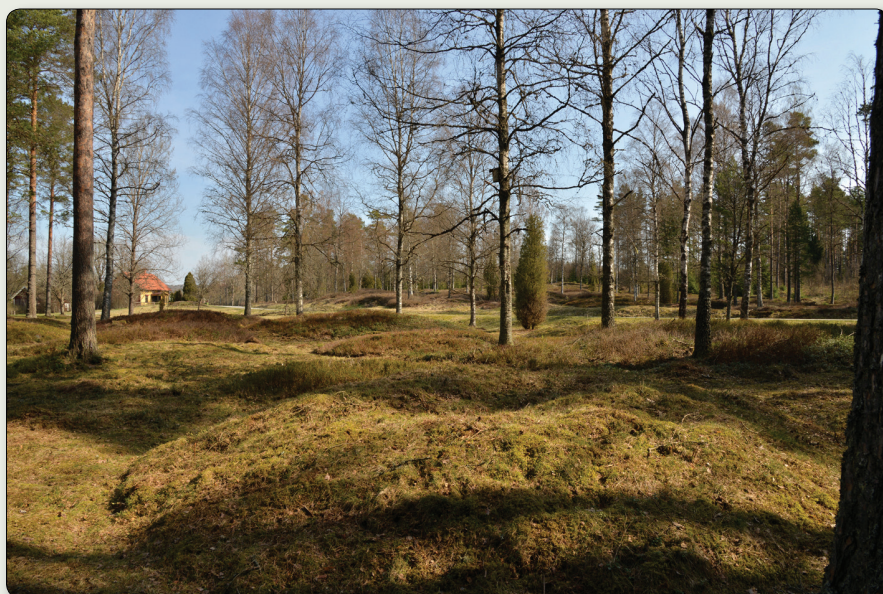
400 meter söder om Bringetofta kyrka ligger längs landsvägen ett vikingatida gravfält med drygt 150 gravar i form av högar och stensättningar.

Bringetofta kyrka: N6366976 / E 477124 (SWEREF 99 TM). N 57° 26' 41,64", E 14° 37' 7,94" (WGS84)