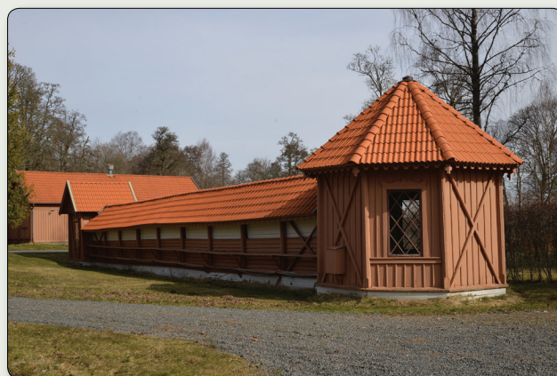
Kägelbanan i närheten av Engelska villan.

En sexhåls golfbana invigdes år 1888 och den var den första i Sverige. En tennisplan hade anlagts ca tio år tidigare, också denna var en av de tidigaste i sitt slag. Vidare byggdes en kägelbana, som troligen också uppfördes på 1880-talet. Under tidigt 1900-tal beskrivs Ryfors som en av Sveriges ”största och mest konstmässigt anlagda privata parker”.