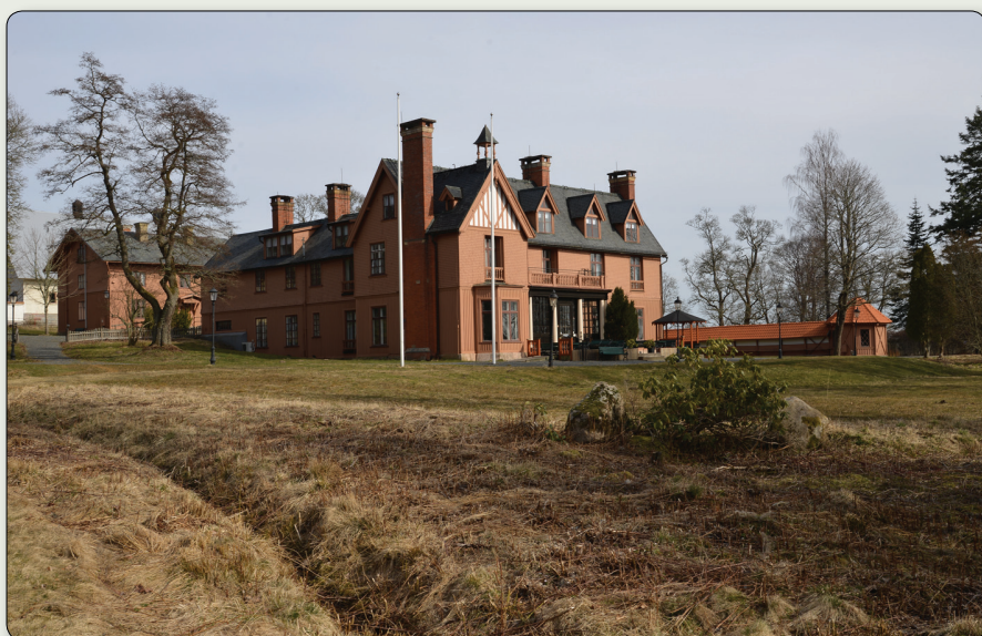
Engelska villan på Ryfors.

N 6418710/E 430445 (SWEREF 99 TM) // N 57° 54' 17,134", E 13° 49' 34,893" (WGS84)