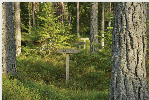
Utstakad hålväg ingående i Eriksgatuleden.

Med sydlig start vid Sandhems kyrka löper ett omfattande hålvägssystem norrut upp mot Kymbo på andra sidan länsgränsen. Hålvägssystemet är ca 12 kilometer långt och följer bitvis dagens vägar. Det var kungens färdväg men också gamla vägen mellan Skara och Jönköping. Idag kan vi följa en del av Eriksgatuleden eftersom en sju kilometer lång vandringsled iordningställt med start vid Sandhems kyrka, alternativt i Slättäng vid riksväg 47.