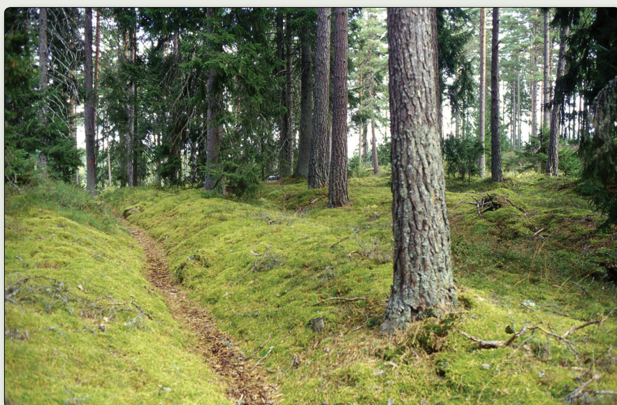
Hålvägar ingående i Eriksgatuleden i Sandhem.

Södra delen av leden (RAÄ Sandhem 29:1): N 6429318 / E 428495 (SWEREF 99 TM) // N 57° 59' 58,96" E 13° 47' 24,94" (WGS84)