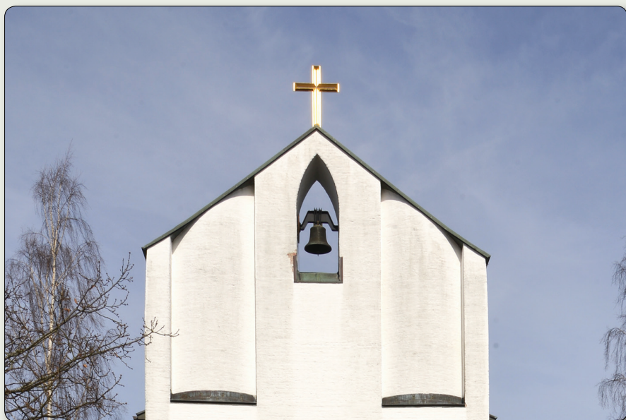
Kapellkrematoriet från 1958 ritades av arkitekt Lars Israel Wahlman och dekorerades invändigt av Sven X-et Erixon.

N 6401648 / E 449218 (SWEREF 99 TM) // N 57° 45' 22,701" E 14° 8' 59,1" (WGS84)