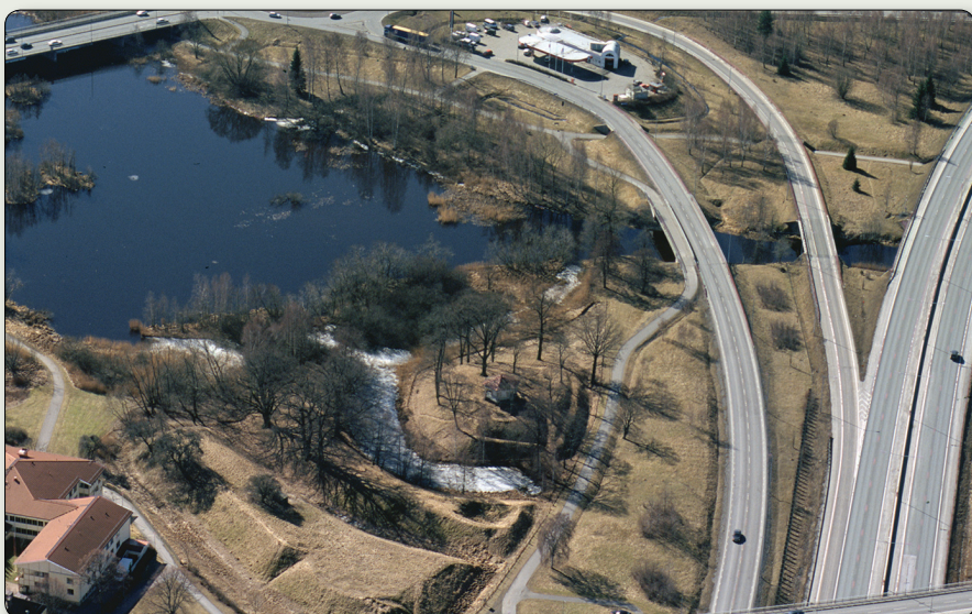
Den medeltida borgruinen Rumlaborg i dagens urbana miljö i Huskvarna, intill Huskvarnaån.

Ruinen består idag av en borgkulle omgiven av tre vallar och vallgravar. På kullen står ett lusthus uppfört 1845, som under en tid fungerade som bibliotek till gården Rosendala. Fynd från arkeologiska undersökningar i Rumlaborg under 1930-talet finns att bese på Huskvarna stadsmuseum i Kruthuset.