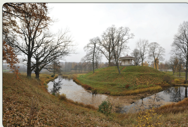
Rumlaborg anlades på byn Humblarums ägor under 1360-talet och blev ett maktcentrum i ett slottslän till en bit in på 1500-talet.