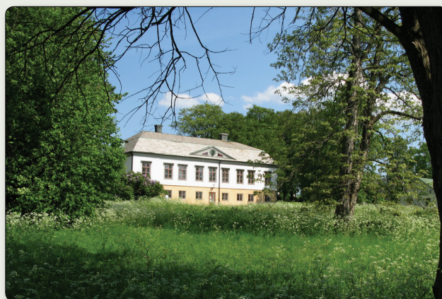
Rosenlunds herrgård med den igenvuxna västra parken i maj 2011.

Öster om herrgårdsbyggnaden låg tidigare en nyttoträdgård med fruktträd och grönsaksodlingar. Här uppfördes ett stall för stadens polishästar. Det första rosariet skapades 1978 och har sedan dess byggts om och utökats. Idag rymmer planteringarna omkring 500 olika sorters rosor med fokus på äldre varianter. Rosenlunds Rosarium är idag ett välbesökt utflyktsmål och anläggningen fungerar som regionalt klonarkiv för rosor inom Programmet för odlad mångfald (POM).