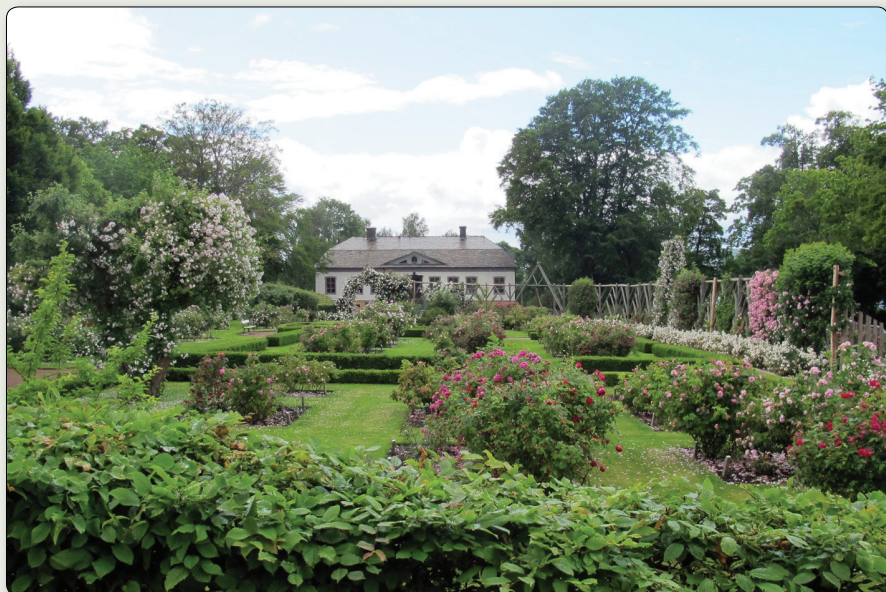
Blomsterprakt i Rosariet öster om herrgårdsbyggnaden vid mitten av juli 2012.

N 6404822 / E 453180 (SWEREF 99 TM) // N 57° 46' 58,76", E 14° 12' 45,54" (WGS84)