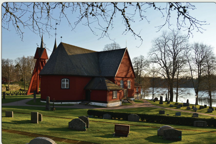
Bottnaryds kyrka vackert belägen vid sjön Gårdsjön.

N 6404176 / E 429982 (SWEREF 99 TM) // N 57° 46' 26,99", E 13° 49' 22,13" (WGS84)