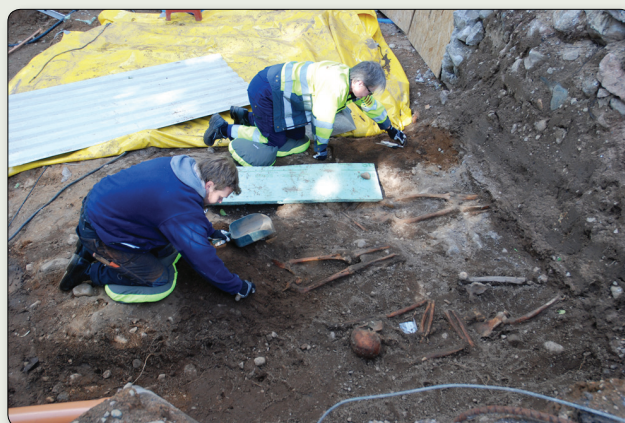
Arkeologer undersöker gravar vid kyrkan.

År 2012 utförde Jönköpings läns museum en arkeologisk undersökning i området direkt väster om kyrkan, där en utbyggnad skulle uppföras. Inom 20 m 2 framkom delar av 25 gravar, alla begravda innan den medeltida kyrkan revs. Den troliga dateringen av dessa gravar sträckte sig från 1400-talet och fram till det att kyrkan revs och den nuvarande träkyrkan började byggas 1666. I sex av gravarna har ett mynt lagts ner, ett så kallat Karonsmynt, placerat i munnen eller vid huvudet. Myntet skulle tjäna antingen som betalning till Sankte Per eller kanske för att förhindra att personen skulle gå igen. De gravlagda var alla vuxna och könsfördelningen var jämn. Tandhälsan tycks ha varit dålig och flera individer visade tecken på kraftiga förslitningsskador och ålderstecken. En kvinna hade en sammanväxt ryggrad, revben och höft vilket säkert orsakat stor smärta. För de efterlevande har det varit viktigt med ett bra liv efter detta, vilket mynten som skulle underlätta övergången till himmelriket visar.