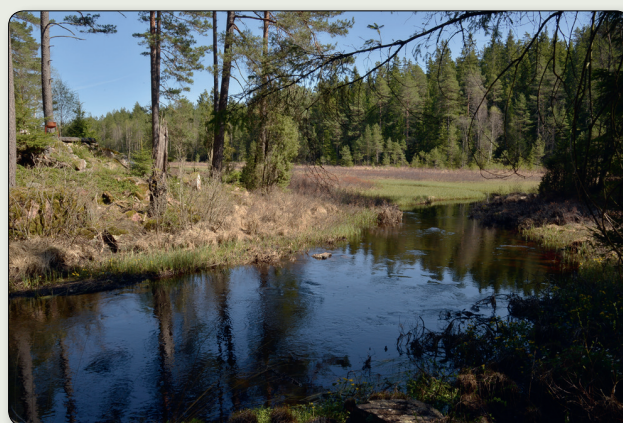
Dammen uppströms flottningsrännan.

På platsen finns en utförlig skylt om flottningshistorien i Valån. En grillplats är anordnad där man kan inta medhavd matsäck i skön natur.