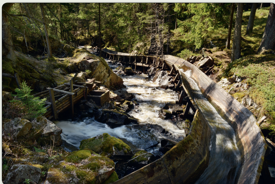
Restaurerad flottningsränna i Valån.

Koordinater: N 6369208 / E 422981 (SWEREF 99 TM). N 57° 27' 32,38", E 13° 42' 58,56" (WGS84)