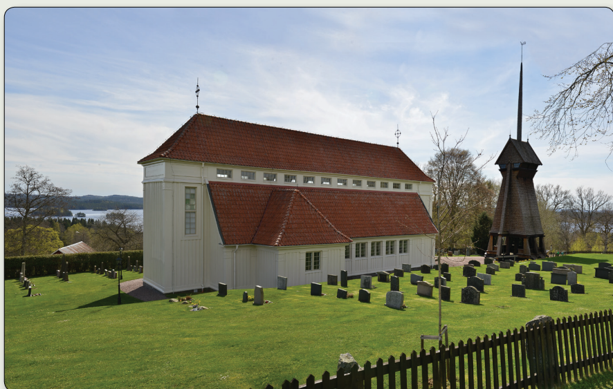
Stengårdshults kyrka och klockstapel.

N 6379510 / E 429500 (SWEREF 99 TM) // N57° 33' 9,288", E13° 49' 18,798" (WGS84)