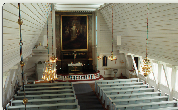
Stengårdshults kyrkas interiör.

Arkitekten Grut var i ungdomen idrottsman och svensk mästare i tennis. Detta var väl en anledning till att han fick rita Stockholms stadion. Under sitt yrkesliv fick han rita flera andra träkyrkor i bland annat Norrland.