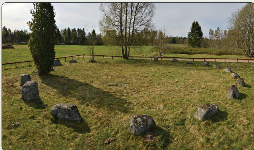
En av domarringarna i domarringsgravfältet, Smålandsstenar.

N 6337618 / E 404952 (SWEREF 99 TM). N 57° 10' 18,86", E 13° 25' 40,93" (WGS84)