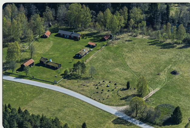
Flygbild över Västbo hembygdsgård och domarringarna i Smålandsstenar. Bakom träridån i bakgrunden rinner Nissan. Foto från SV.

Ända sedan domarringar började anläggas under bronsåldern har de tilldragit sig människors intresse. Exempelvis trodde Carl von Linné att de var tingsplatser medan andra tänkt att de använts för sjukdomsbot, gudaoffer, anfaderskult, astronomiska studier eller varit samlingsplatser vid större högtider. I lokal tradition kallas vissa domarringar för danskgravar och relateras till de danska krigstågen på 1560-talet. I dag är domarringsgravfältet ett av länets smultronställen och är lokalt platsen för det årliga valborgsmässofirandet.