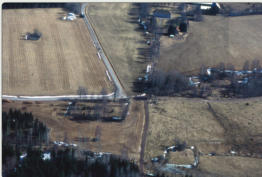
Flygfoto från Edshult med säteribyggnaden i bakgrunden, kyrkoplatsen till vänster och borgruinen i förgrunden.

N 6380853 / E 511186 (SWEREF 99 TM) // N 57° 34' 11,97", E 15° 11' 13,22" (WGS84)