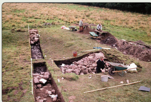
Arkeologisk undersökning av borgkullen 1989.

Hur borganläggningen såg ut kan vi ana tack vare en arkeologisk utgrävning 1989. Den visade att den norra vallgraven varit ca fem meter bred, en meter djup och kantats av tätt ställda störar. Innanför vallgraven stod ett kvadratisk trätornt på en liten kulle. Tornet var byggt på en grästensgrund av 1,5 meter tjocka murar och hade flera våningar. Öster om tornet finns spår efter ytterligare en byggnad och väster om tornet låg en smedja. Utgrävningarna visade också att borgen brunnit och byggts om flera gånger under 1300- och 1400-talen. Troligtvis var borgen ingen stark befästning, utan ämnad för lokal kontroll och för att visa borgherrens status.