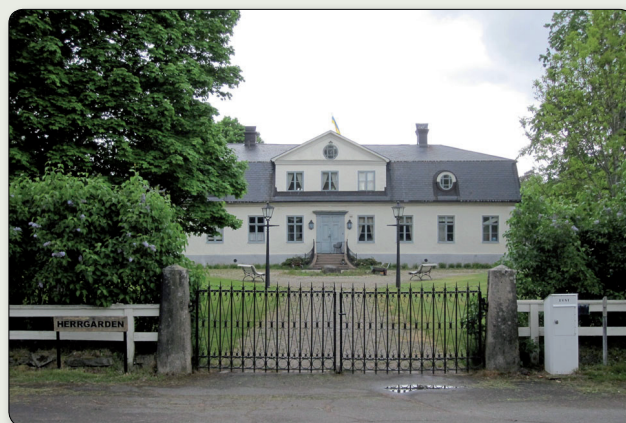
Herrgårdsbyggnaden från 1780-talet.

Ytterligare ett maskinduksväveri skapades mer centralt i samhället. Genom ägarens stora intresse för trädgårdskonst uppfördes ett ultramodernt växthus omkring 1960 med en kvadratisk försäljningslokal, kallad Kristallen.