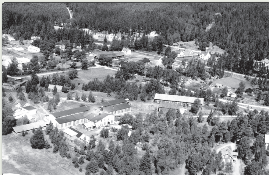
Flygbild 1947 över Bruzaholm med järnbrukets byggnader i den nedre delen av bilden till vänster.

N 6388789 / E 516025 (SWEREF 99 TM) // N 57° 38' 28,155", E 15° 16' 6,473" (WGS84)