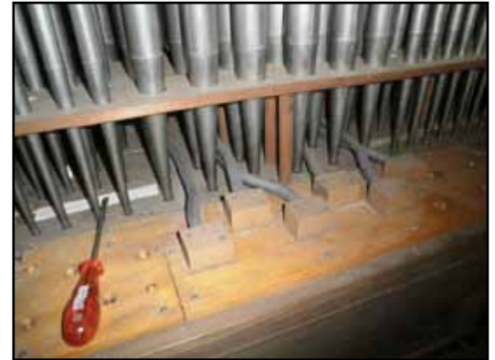
Rörflöjten från 1942 sitter på en ny pipstock på trumpetens gamla plats. Zinkrör förbinder den med basoktaven i Gedacht 8'.