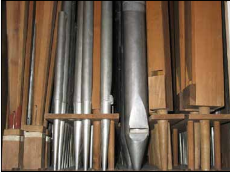
Blick in genom vänstra sidoluckan. Från vänster: Trumpet 8' (1839), Qvinta 3' (1839), Fugara 4' (1895), Principal 8' (1895), Fleut amabile 8' (1839), Octava 4' i fasaden (1839). Erik Nordströms tillskott medförde att utrymmet för piporna begränsats kraftigt. Nedan blick in genom högra sidoluckan.