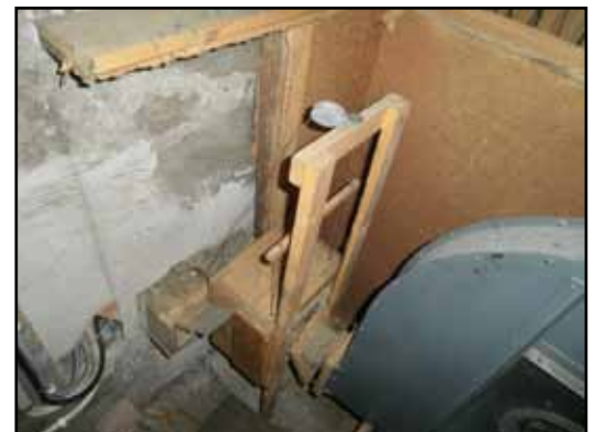
Den gamla fläkten.