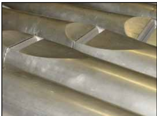
Sven Nordströms Qvinta 3', av brodern Erik försedda med tätare kärnstick för en dovre, mer romantisk klang.