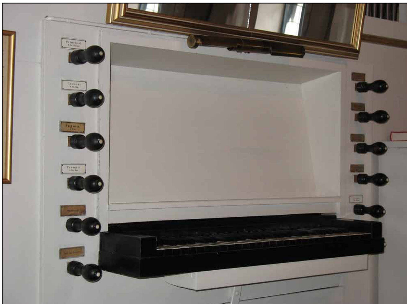
Spelbordet efter restaurering, rensat från kablage och strömvred, pedalarmatur inmålad, registerskyltar kompletterade, ny notbräda, bättringsmålning, rengöring.