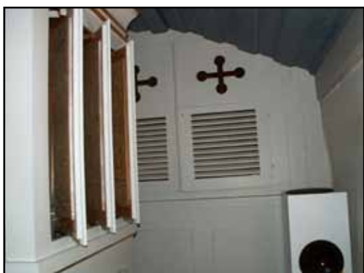
I förgrunden svällverksluckorna på högra sidan. I bakgrunden skåpet för pedalstämman från 1895 och bälg med trampa från 1942.

Bälaryds trumpetstämman är den äldsta som bevarats av Nordström, den trumpetstämman han byggde för orgeln i Ökna 1838 är idag försvunnen. Trumpetens grova oktav har mycket vida uppsatser som ger en basunliknande klang. Syftet med detta var sannolikt att ge intryck av en självständig pedalstämman i denna relativt lilla orgel. I Bälarydsorgeln finner vi också den rent romantiska stämman Fleut d'amour som är något av ett signum för Sven Nordströms orgelverk. Nordströms orglar kännetecknas genomgående av ett högkvalitativt hantverk som stått sig mycket väl.