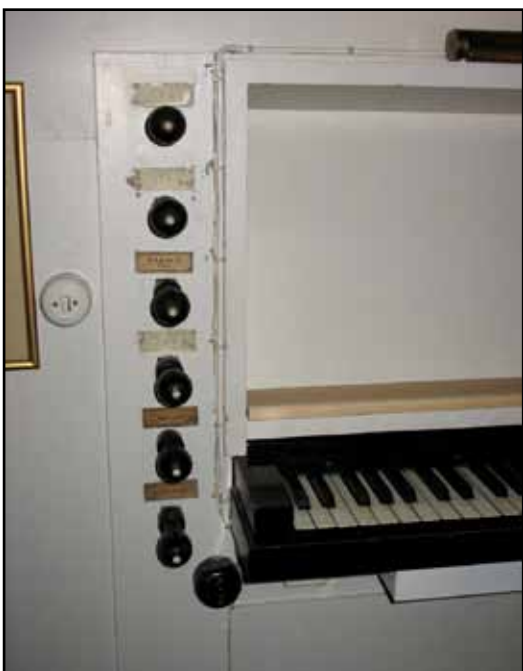
Vid spelbordet finns en påfallande kabeldragning, tre olika strömbrytare och en stor kopplingsdosa som stör intrycket.

Befintlig fläkt från omkring 1953 har en öppen kollektor. Den står i tornet i en enkel oisolerad låda som är en brandrisk. Bälgarna från 1942 är i gott skick, likaså luftkanalerna som till stor del härrör från 1839, i furu med skinntätningar.