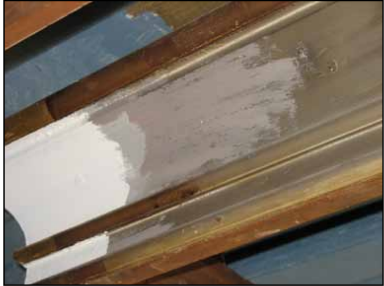
Tidigare färgsättningar är synliga på skynda delar av krönlisen.