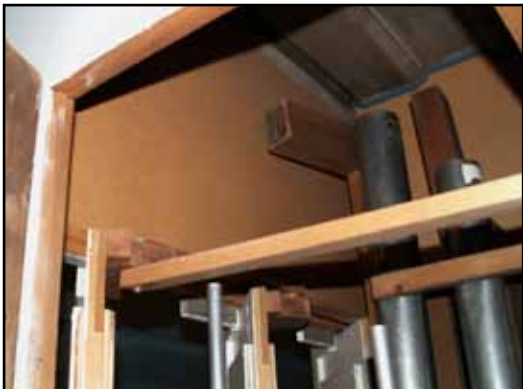
Orgelhuset är invändigt klätt med masonit för att fungera som crescendoverk genom kortsidornas luckor. Detta syns även bakom fasadpiporna.