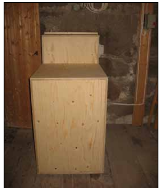
Ny fläkt med inklädnad i tornets andra våning.

Sven Nordströms Trumpet 8' påträffades på skolhusets vind och kunde restaureras och sedan återbördas. Rörflöjten från 1942 demonterades med tillhörande pipstock och zinkrörskopplingar. Stämman magasineras i tornet. Flera av trumpetuppsatserna var kraftigt deformerade, men kunde riktas. Hål har lagats och nederdelen bytts ut på flera. Några uppsatser i diskanten är helt nyttillverkade och patinerade med järnoxid. Trumpetstockarna var