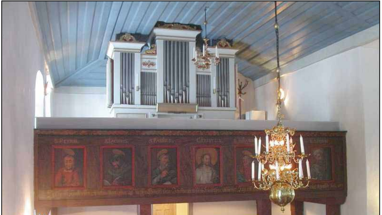
Nordströmorgeln fotograferad 2005. På orgelhusets kortsidor är svällverksluckor från 1942. Den rent vita färgsättningen är ett resultat av kyrkorummets ommålning 1984.