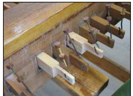
Lagningar på pedalklaven.

De tre vanprydande strömbrytarna (fläkt och belysning) i anslutning till spelbordet avlägsnades liksom kopplingsdosan och en klumpig kabeldragning med plastklamrar till spelbordsarmaturen i mässingsplåt. Armaturen i sig bedömdes kunna behållas. En ny tunnare kabel drogs från ett nyupptaget hål vid sidan av spelbordet och längs dess övre utkragning med metallklamrar för att sedan målas in. Anledningen till att kabeldragningen inte kunde göras helt på insidan av orgelhuset berodde på att väderlådan börjar direkt över notnischen. Kablaget inne i orgelhuset byttes ut. Nya strömbrytare av modell ELJO, vita i termoplast, monterades på orgelhusets baksida mot läktartrappan, en kontrollströmställare för bälgen (art.nr. 1831362) och en dubbelvippa för manual- respektive orgelfasadsbelysning (art.nr. 1831316).