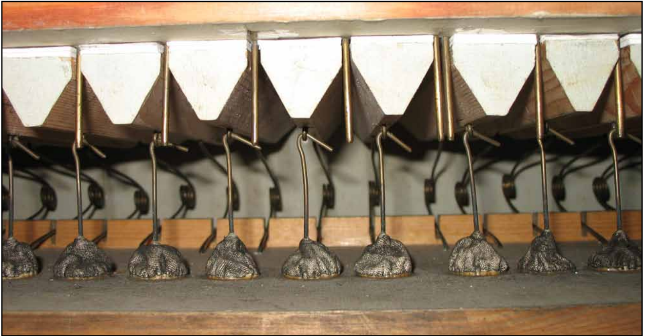
Blick in i manualens väderlåda. De ursprungliga ventilerna har fått ny fårskinnbeläggning istället för den röda filten från 1942. Även pumpetpåsarna är original från Sven Nordström.