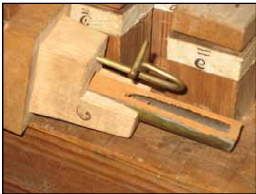
Belädrat munstycke på Trumpet 8'.