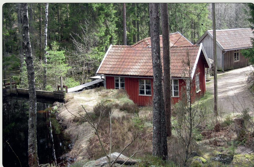
De till synes enkla byggnaderna rymmer både historia och teknik. Närmast fabriksbyggnaden Andersfors uppförd på plats 1908. Bakom denna skymtas "Lill-Andersa slipe" som inrymde Gnosjös första hårnålsfabrik och en smedja.

N 6358556 / E 425265 (SWEREF 99 TM) // N 57° 21' 49,05, E 13° 45' 27,14" (WGS84)