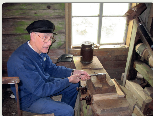
Interiör från kruköronshammaren.

I Töllstorp kan man se hela produktionskedjan från räckhammare och tråddrageri till handvävstolar för tillverkning av metallduk och olika enkla maskiner för tillverkning av hårnålar, hönsglasögon, kruköron och andra produkter. Hembygdsföreningen håller museet öppet under sommarmånaderna och arrangerar visningar.