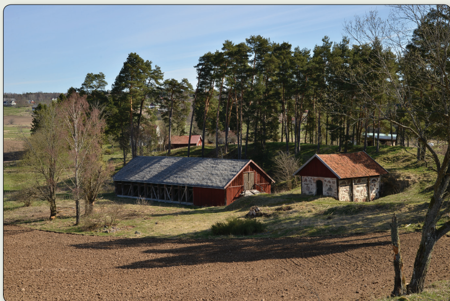
Det gamla tegelbrukets torklada till vänster och tegelugn till höger.

Bredestads kyrka: N 6408317 / E 491336 (SWEREF 99 TM) // N 57° 49' 0,096", E 14° 51' 15,163" (WGS84)