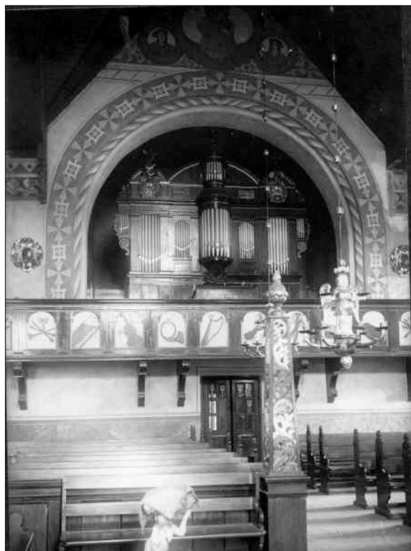
Orgelläktaren över huvudingången i väster, med 1892 års dekormåleri och den breda läktarbalkongen. Bänkarna byttes ut och orgeln flyttades till södra korsarmen ovanför gravkoret. Foto Carl Källström från 1900-talets början, ATA