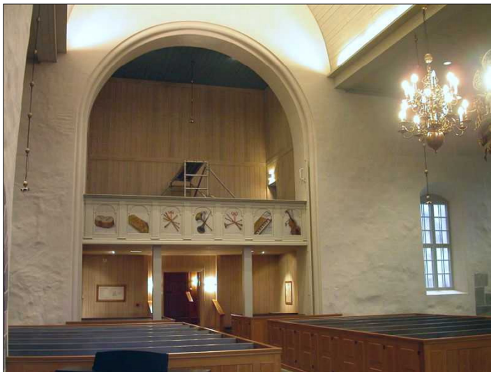
Vy mot väster, läktaren i sitt nuvarande skick från 1960-talet. Läktarbröstningen består av paneler som målats med musikinstrument vid okänt tillfälle. Under detta färglager finns porträttfigurer målade av Pehr Hörberg 1773.

Nydala klosterkyrka och bondkyrkan är tillsammans med Alvastra en rest av Nordens äldsta cistercienserkloster, därtill fortfarande i bruk. Kyrkan har en tydlig historisk läsbarhet som är viktig för möjligheten att uppfatta dess historia. Av mycket högt kulturhistoriskt värde är det ursprungliga murverket i kvaderhuggen granit, bevarat främst i koret och norra korsarmen, men delvis även i södra korsarmen. Viktiga karaktärsdrag att värna om från kyrkans äldsta historia är den cisterciensiska arkitekturens enkelhet i detaljer och rumsbehandling, men utfört med påkostade material och kvalitet. I