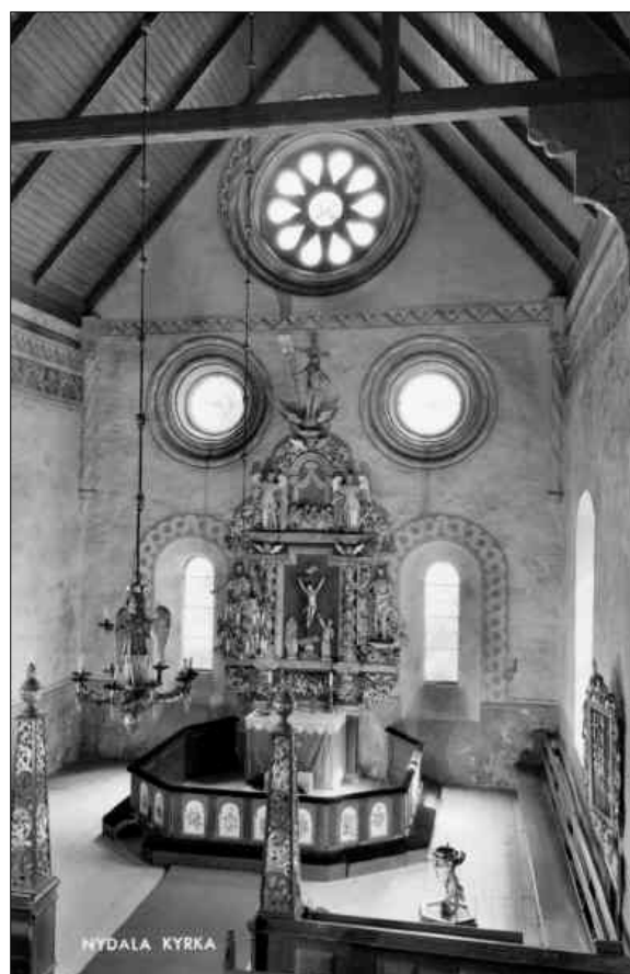
Vy mot öster och koret. Dekormåleriet från 1892 på östra korväggen finns kvar under nuvarande puts. Dessa inspirerades av målningarna i Vrigstads gamla kyrka. Foto från 1900-talets början.