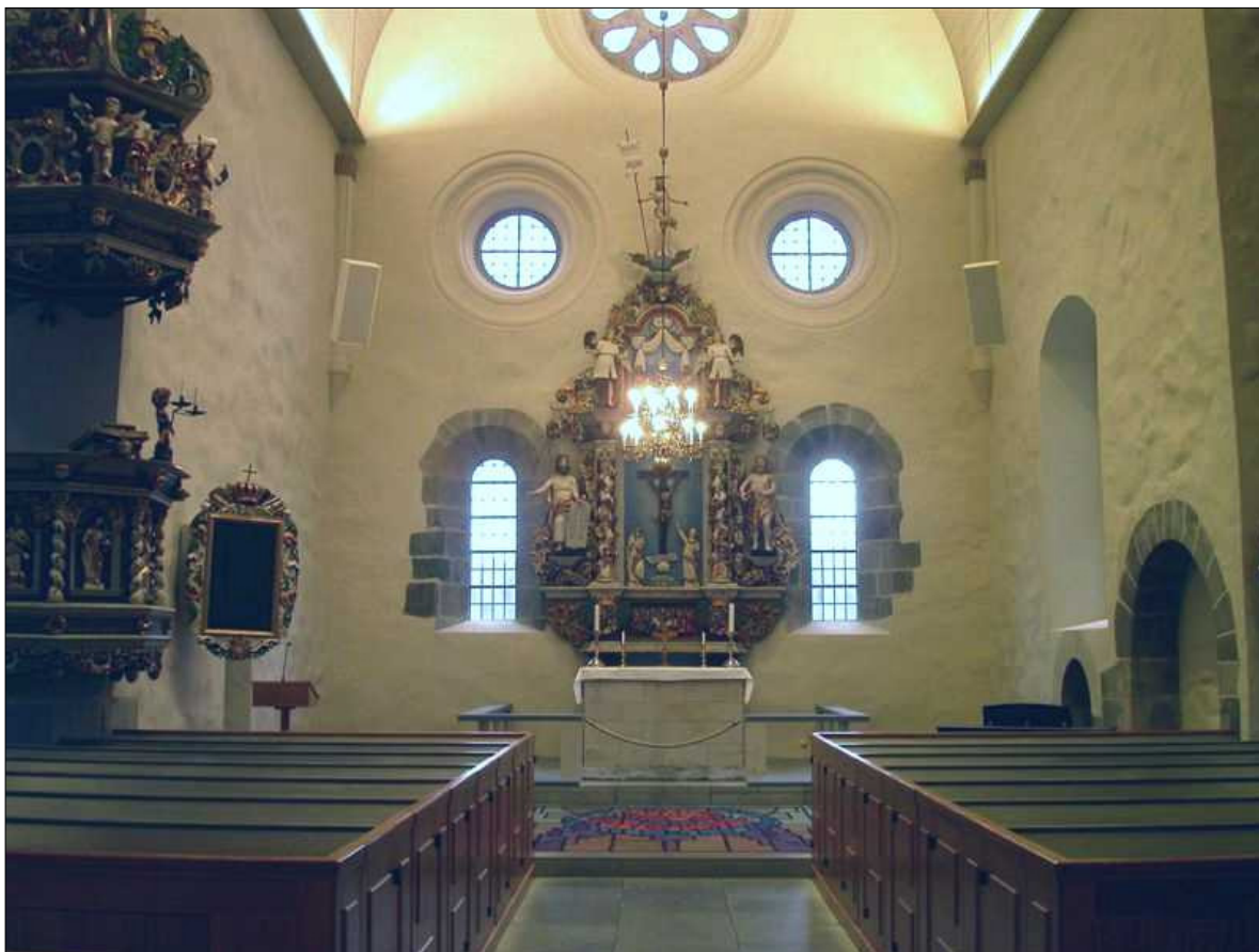
Interiörbild av koret, vy mot öster. I korets södervägg skimtar till höger nischerna för piscina, skåp och sittnisch.

Mot korets östvägg finns två troligen ursprungliga hörnknektar som förlorat sin valvbärande funktion – eller möjligen aldrig varit i funktion. Om kyrkan valvslogs gjordes den troligen det under den andra byggnadsetappen vid 1200-talets mitt och då med tegelvalv. Det tunnvalvda innertaket över mittskepp och kor tillkom på 1960-talet, liksom den takpanel som de plana brädtagen i korsarmarna kläddes med. Golvet av kalkstensplattor och tegel som lades i hela kyrkan utom i vapenhuset tillkom också på 1960-talet. Södra korsarmen är sedan 1967 orgelläktare, och under denna finns gravkoret från 1704 som byggdes för familjen Stromberg i samband med att de bekostade tornbyggnaden. Den norra korsarmen har kvar de ursprungliga sidokapellen, det norra av dessa används som kapell, medan det södra inretts som sakristian. I sakristian finns väggmålningar på östra och södra väggen, troligen från 16- eller 1700-talet och är det enda stället där dessa syns. I övrigt präglas den norra korsarmen av uppgången till predikstolen samt den sentida dopfunten. Även om restaureringen på 1960-talet präglade hela kyrkan märks den tydligast med sin egen tids närvaro i vapenhuset och förhallen till kyrkorummet, under läktaren. Här är det enhetligt modernt, med vitlaserad furupanel, enkla och raka linjer och spartanskt möblerat med låga sidobänkar.