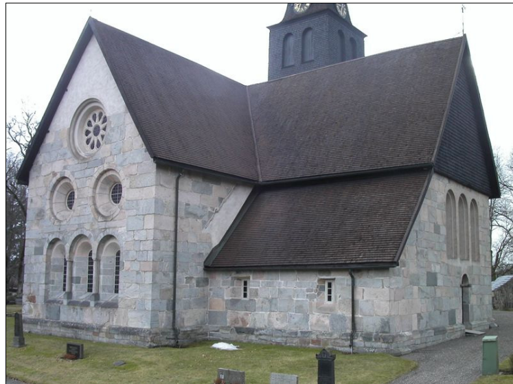
Östra gaveln och norra korsarmen med utbyggnaden för sidokapellet. Ovanför sidokapellets tak ses delar av ursprungligt taktäckningsmaterial, skifferliknande stenskivor. De tre fönsteröppningar i norra gaveln är från 1892.

Kyrkan är uppförd som klos-terkyrka och hade ursprung-ligen en korsplan med kor i öster och konventsbyggnader i söder. Av den ursprungliga kyrkobyggnaden återstår koret, korsarmarna och den östligaste travéen av lång-husets mittskepp. Den södra korsarmen byggdes i stort sett upp från början vid 1600-talets slut då ruinerna iständ-sattes och skiljer sig med sina putsade gråstensmurar genty-mot de bevarade delarna av kvaderhuggen granit. Enda motsvarande byggnad som uppförts med fint kvader-huggen granit är Rydaholms