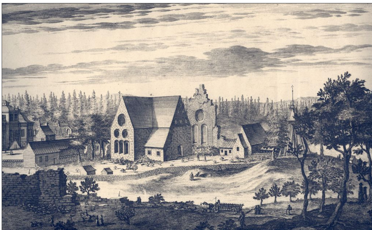
Nydala kloster efter Suecia Antiqua, efter teckningar utförda av Erik Dahlberg under 1690-talet. Klosterkyrkan har nyss återuppförts och den västra gaveln står fortfarande kvar, denna revs till stora delar troligen i samband med att man 1704 byggde klocktornet. Bondkyrkan till höger och herrgården till vänster i bild. Kopparstick i Jönköpings läns museums samlingar.