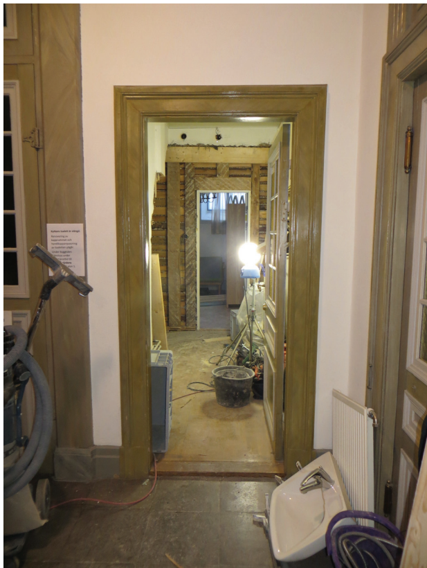
Dörren från vapenhuset mot passagen och toaletten samt rivningen av mellanväggen.