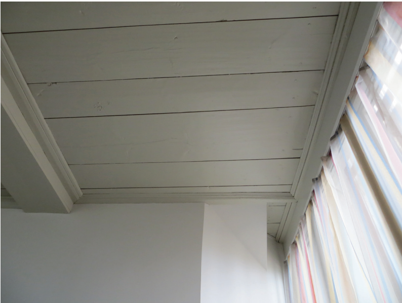
Innertaket i samtalsrummet i den del som inte varit synlig från kyrkorummet.