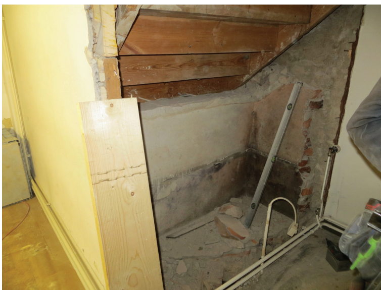
Vid rivningen inför toalettbygget framkom utrymmet under läktartrappan.