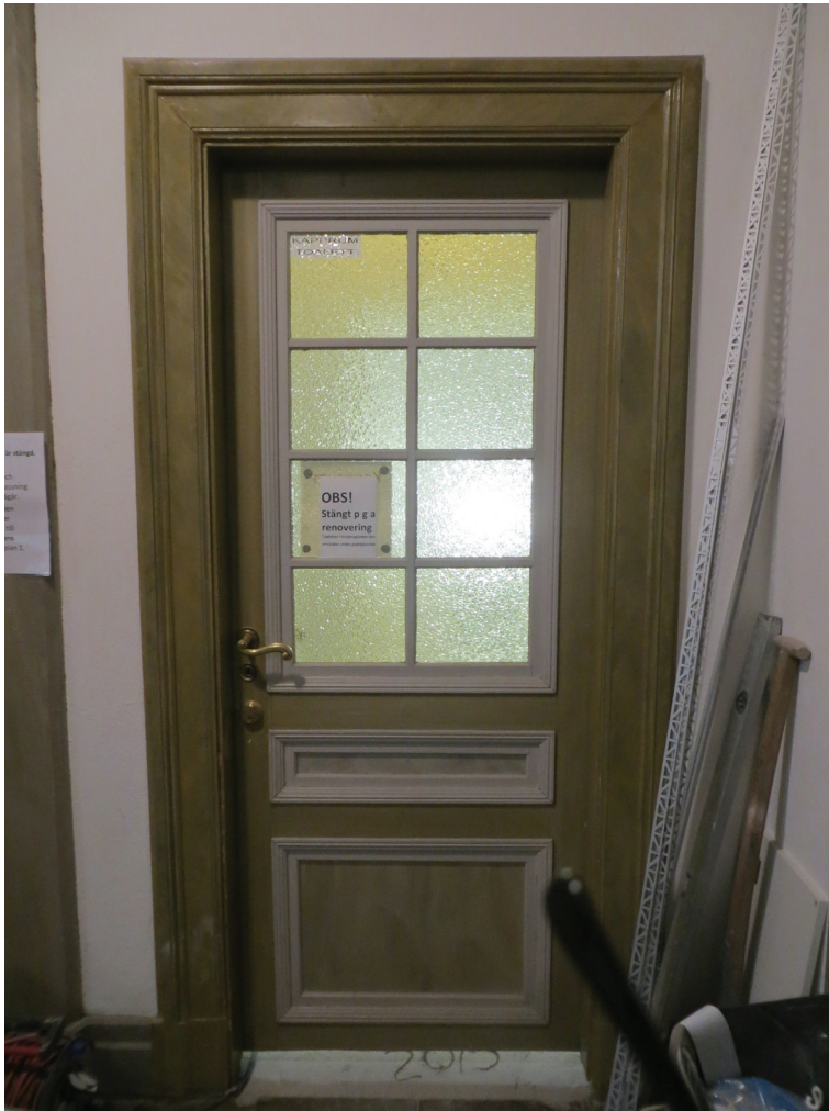
Dörren från vapenhuset mot passagen och toaletten.