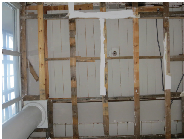
Till vänster: I samtalsrummets nordvästra hörn står, troligen sedan uppförandet av kyrkobyggnaden, en kolonn. Upptill ses reglingen som användes för det sekundära taket samt ovanför detta det frilagda innertaket.