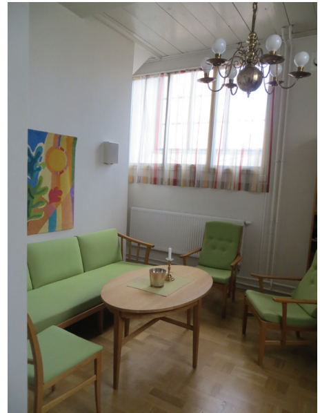
Samtalsrummet efter arbetena.