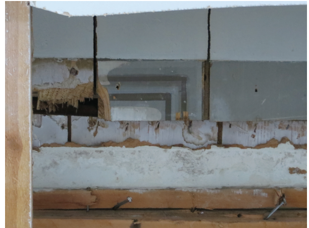
Den i en "låda" dolda dekorationsmålningen som framkom vid arbetena.