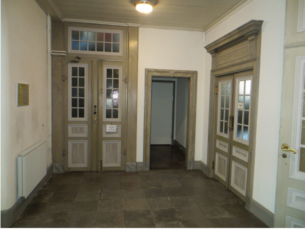
Vapenhuset efter arbetena.