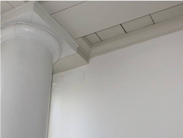
Detalj av innertaket i samtalsrummet.