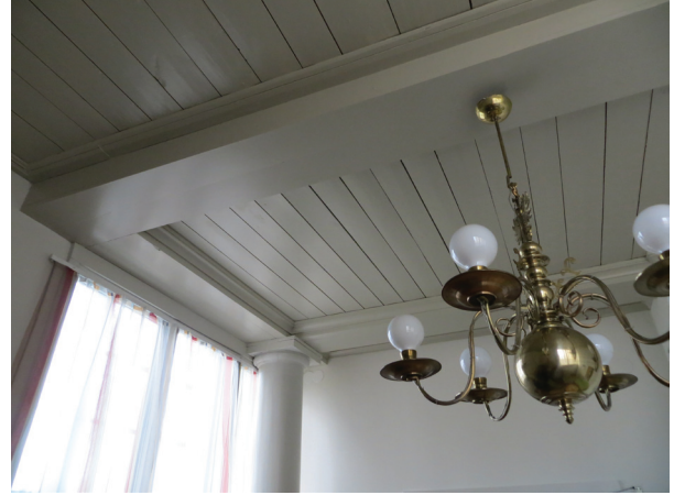
Innertaket i samtalsrummet.