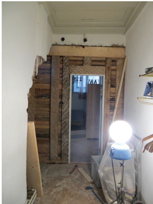
Här syns mellanväggens konstruktion med regler, glespanel, vassmatta och puts.