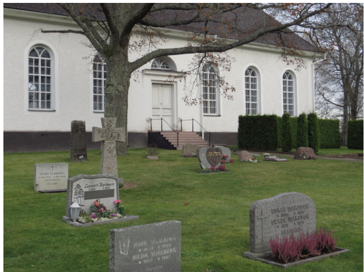
Översikt från söder efter avslutat arbete.