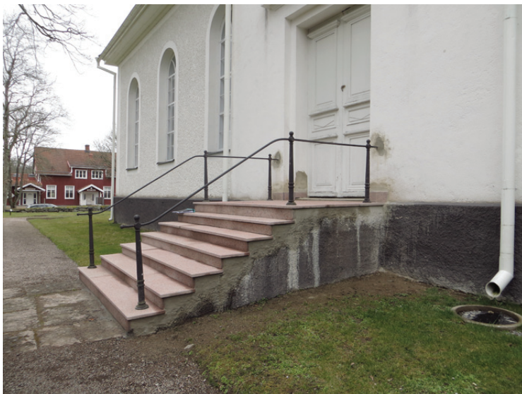
Trappan är omlagd, partiell omputsning av dess sockel återstår.