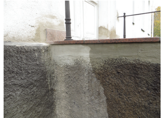
Detalj av trappstenen och den ännu inte spritputsade sockeln.

Läns museets generella synpunkt är att arbetena är väl utförda och i enlighet med länsstyrelsens beslut och de av läns museet preciserade anvisningarna. De slutförda arbetena har genomförts på ett antikvariskt tillfredsställande sätt och godkändes därför.