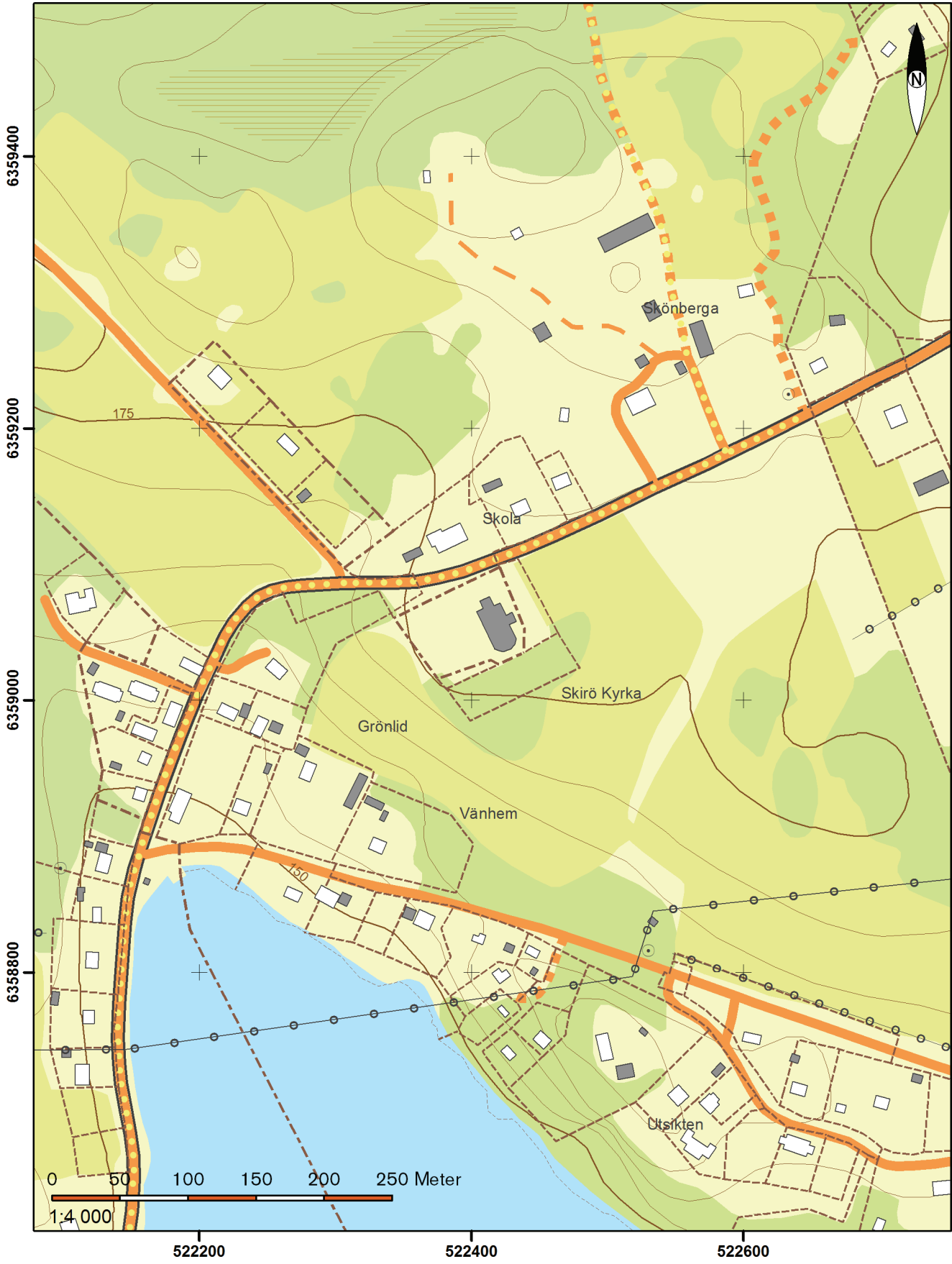
Utdrag ur digitala fastighetskartans blad Skirö: 63F 5cN.