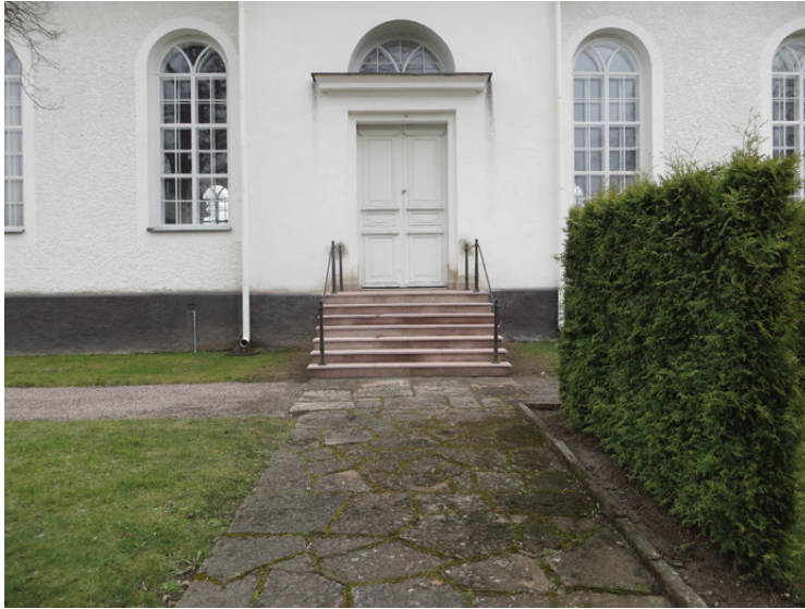
Översikt från söder av den omlagda trappan.