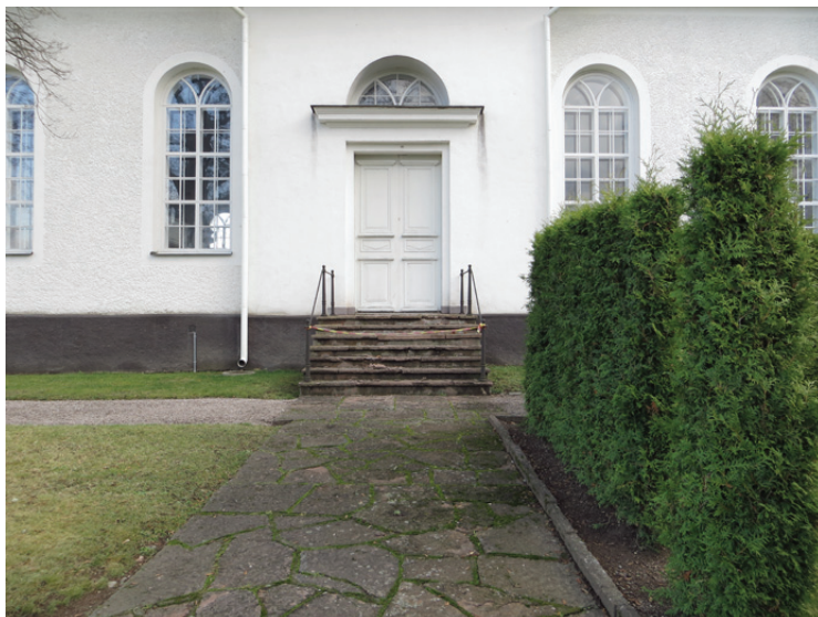
Entrén i söder innan åtgärd.

Det är något oklart när kyrkans sidoentré i väster fick sina trappsteg av kalksten. Sidogången i anslutning till entrén är också den belagd med en röd kalksten av samma slag, förmodligen är dessa åtgärder utförda i ungefär samma tid. Kyrkogården utvidgades 1952 och 1953 genomfördes arbeten på kyrkans sockel och ett rimligt antagande är att trappan fick sin utformning då. Ölandskalksten som gång- och beklädnadssten var mycket populär under 1950- och 1960-talen, vilket också stärker tidsangivelsen. Även huvudentrén vid tornet har en modern trappa, denna är uppförd i en röd granit.