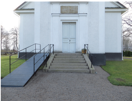
Huvudtrappan är uppförd av röd granit.