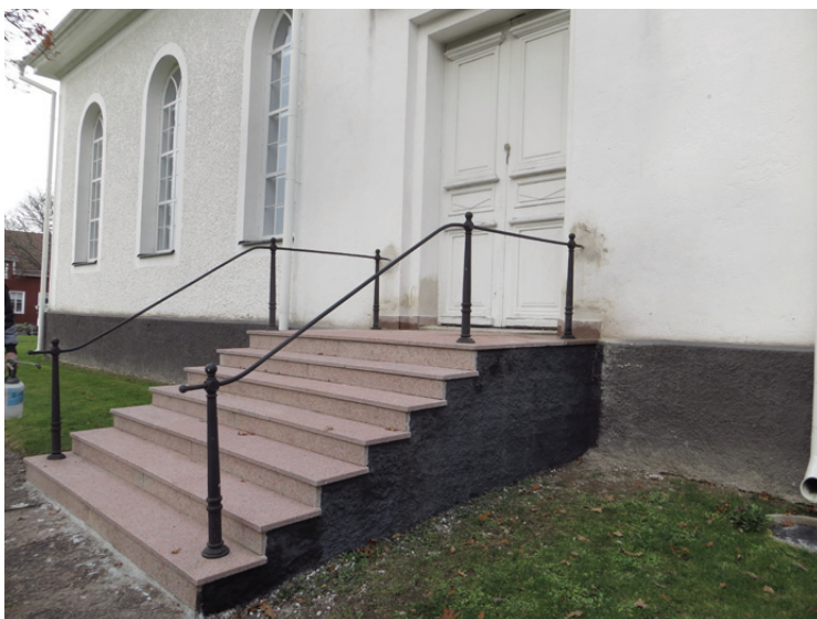
Trappan och dess omputsade och avfärgade sockel. Kulören är mörkare än på kyrkans sockel, men avfärgningen är utförd med samma kulör som då nyttjades.