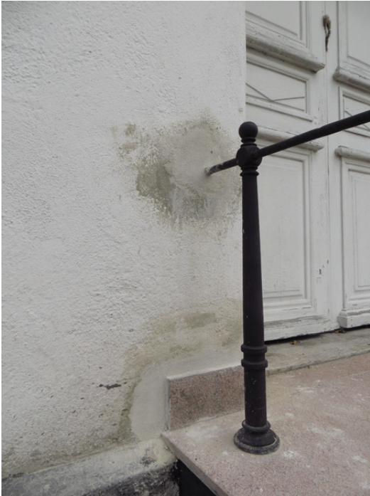
Detalj av räcke och sockelsten.