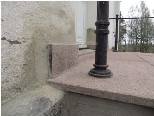
Sockelstenen byttes till sten av samma sort och utförande som trappstenen.