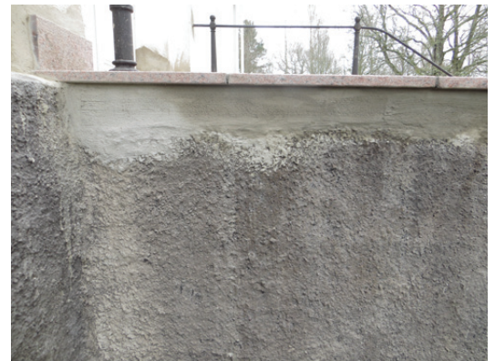
Trappstenen och den ännu inte spritputsade sockeln.