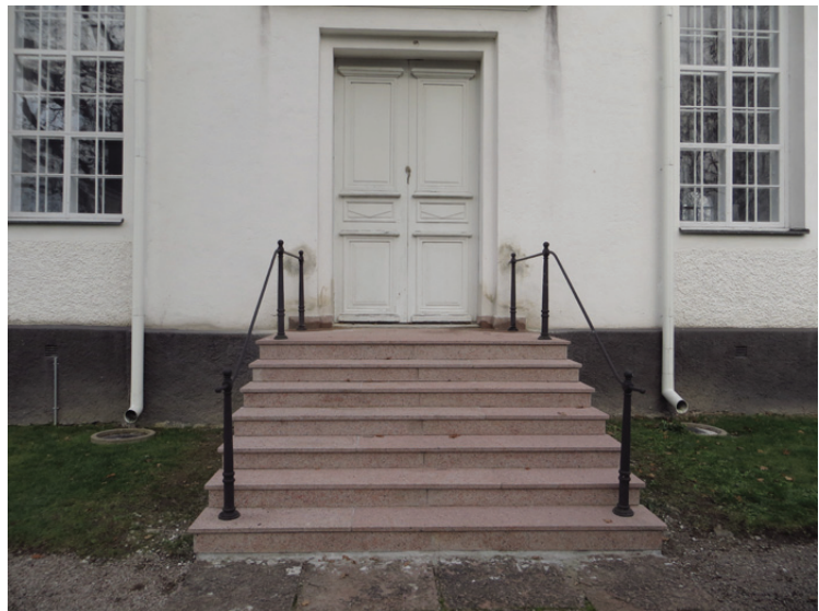
Trappan från söder.