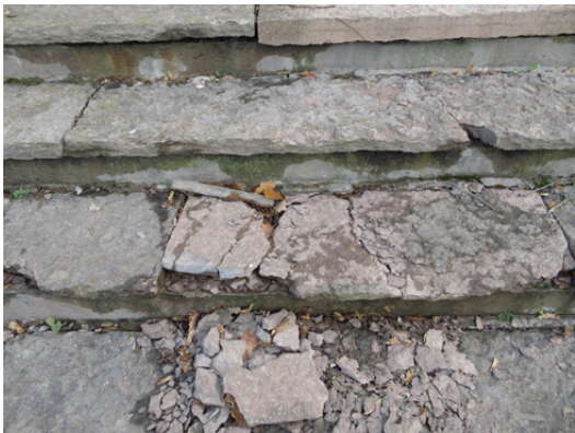
Detalj av den skadade trappan före åtgärd. Vissa steg var vittrade kraftigt.