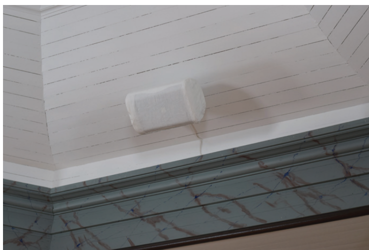
Detalj av den tygklädda högtalaren.

Fotografier tagna vid slutbesiktningen den 27 februari 2015.