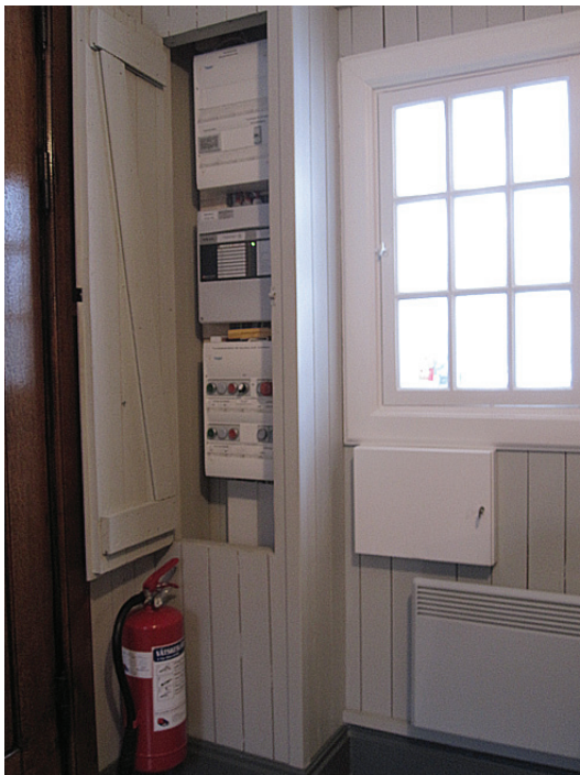
Vapenhuset före åtgärd, med det befintliga platsbyggda skåpet.