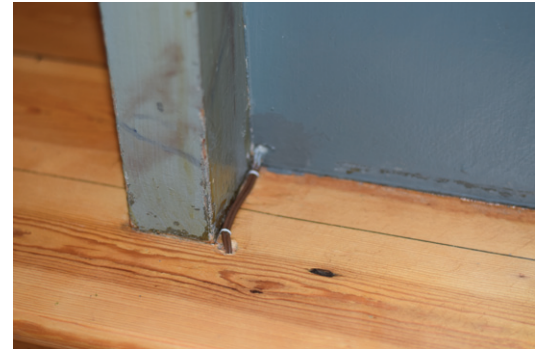
Ovan: detaljbilder av kabeldragningen avseende hörselslingan.