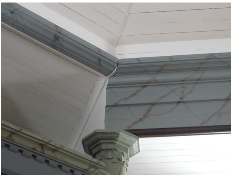
Kabeln är dragen uppe på den marmorerade kraftiga taklisten. Den följer skarven i vinkeln i dragningen ner till manöverpulten.