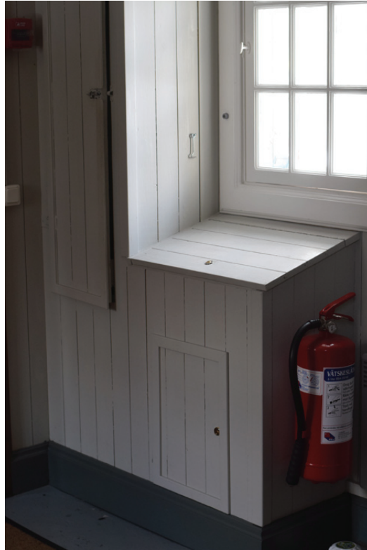
Ljudpulten är platsbyggd och har placerats i anslutning till befintligt elskåp.