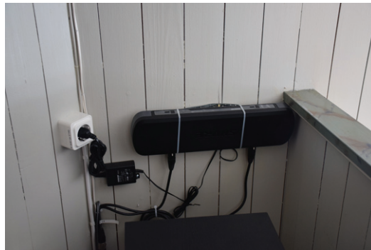
Enheten för de trådlösa mikrofonerna placerad på den lilla orgelläktaren. Den har en lös hängande montering.