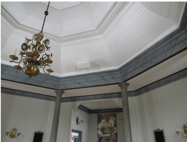
Högtalaren är monterad i taket vid koret.

Lindgren, Anette. 2008. Kulturhistorisk karakterisering och bedömning Anneforskyrkogården . Jönköpings läns museum, byggnadsvårdsrapport 2008:23.