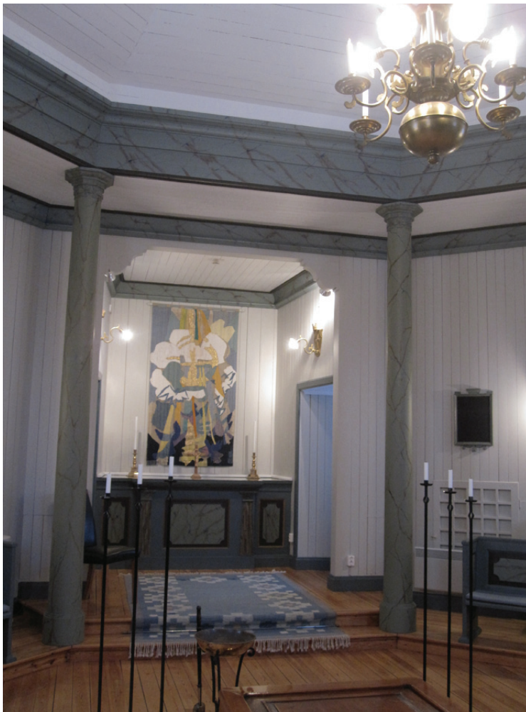
Kapellet med koret i fonden före installationen.

Syftet med åtgärderna var att tillgänglighetsanpassa kapellet ur ett hörandeperspektiv. Ärendet avsåg initialt installation av hörslina, men kom att utökas att också innefatta högtalare utifrån kyrkorådets önskemål.