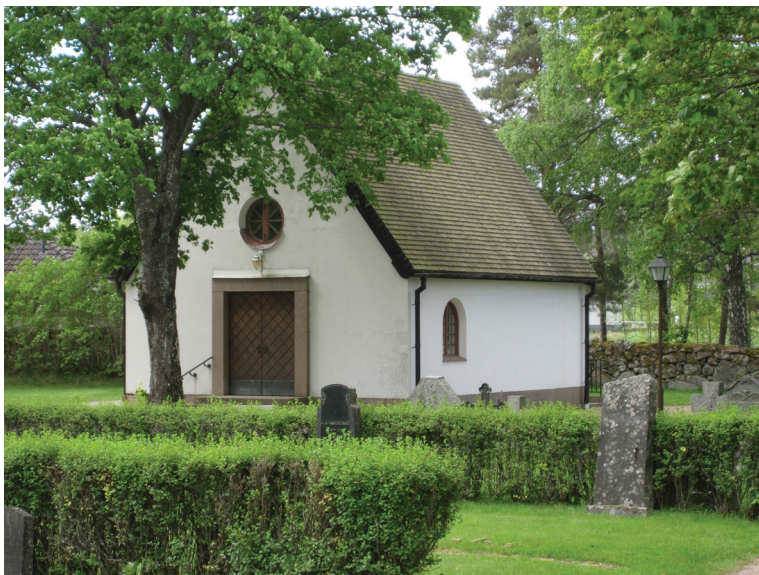
Bårhuset från nordost före arbetena.