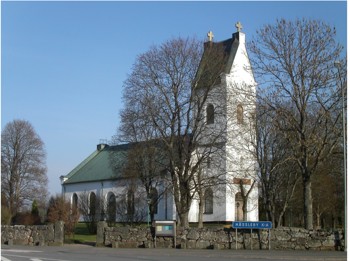
Hässleby kyrka från nordväst. Foto: Jonas Haas, 2004.