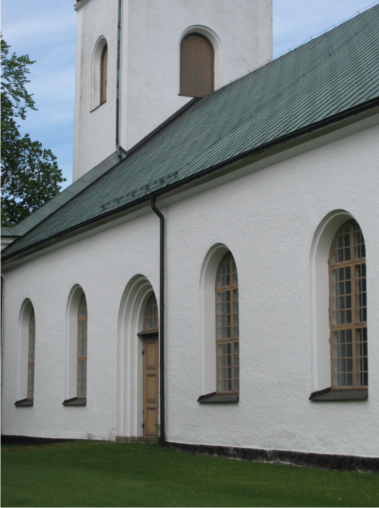
Södra långhusfasaden samt detaljer på port och långhusfönster före ommålning och byte av kulör.