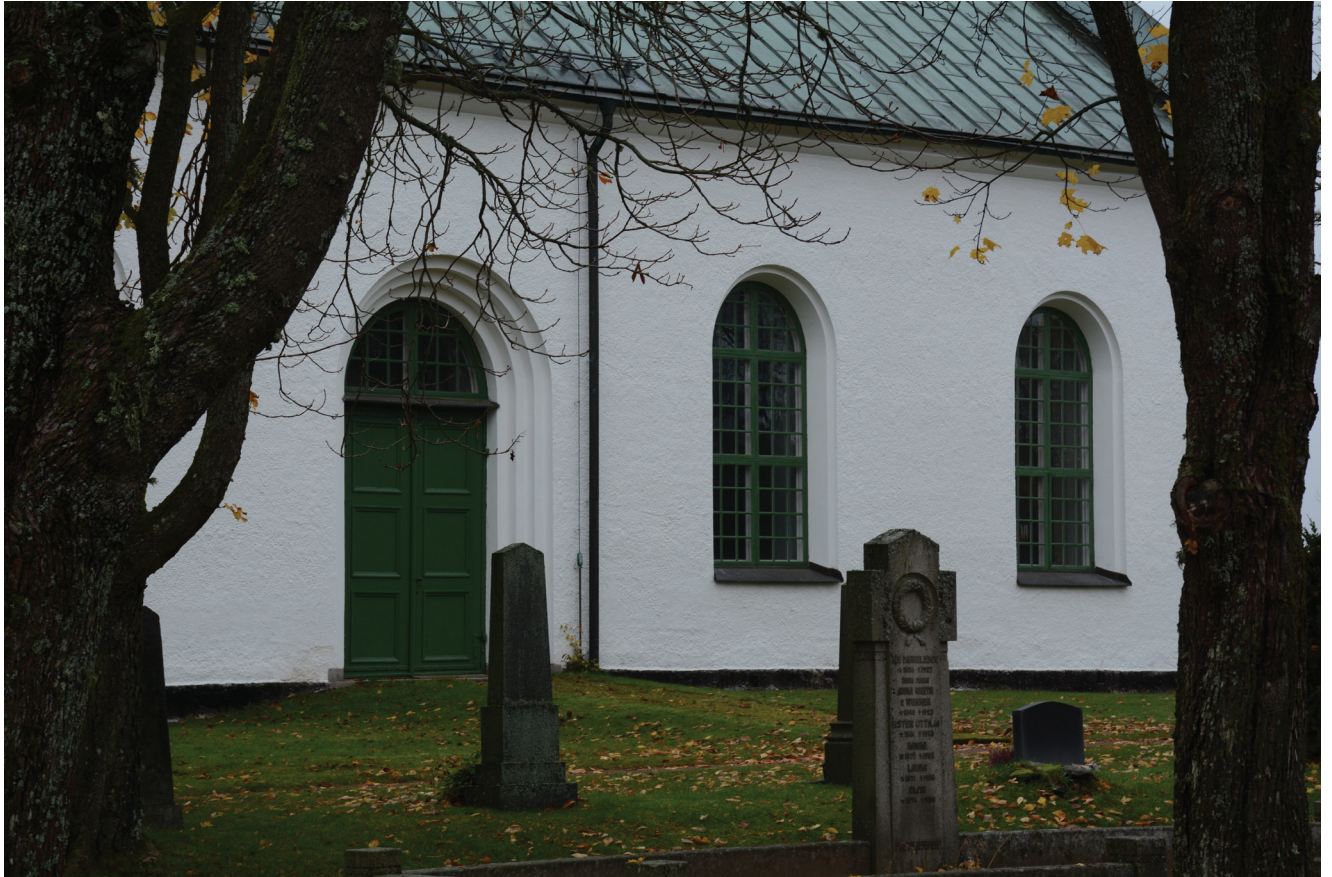
Parti av södra långhusfasaden efter avslutade målningsarbeten. Nedan t.v. det södra tornfönstret efter ommålning. Äldre grön färgsättning återskapad.