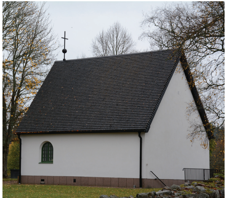
Bårhuset efter utvändig ommålning och tjärning av spåntak.