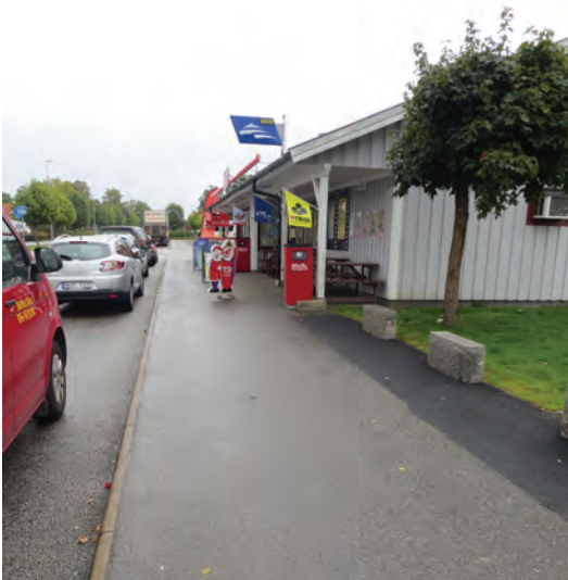
Ovan: Sibyllakiosken i Hillerstorp. Till höger: Haga Vårdshus i Hillerstorp är en samlingsplats bland annat före företagare.