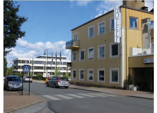
Gästgiverierna har varit betydelsefulla för Gislaveds framväxt. Hotell Nissastigen är en efterföljare till gästgiverifunktionen.

Andra nöjesplatser är exempelvis restauranger, skyttepaviljonger samt cirkus- och tivoliplatser. Dessa har inte kunnat kartläggas specifikt inom projektet.