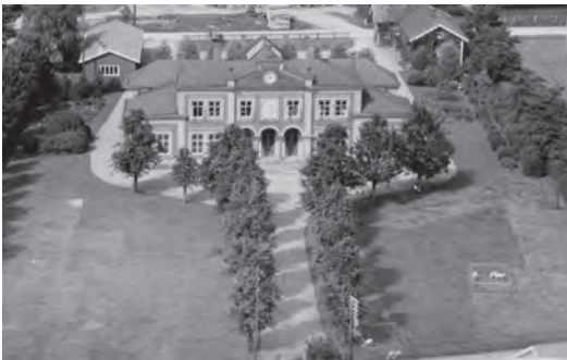
Det gamla tingshuset i Ölme stad i Reftele. JLM.

Flera platser inom Gislaveds och Gnosjö kommuner kan kopplas till en legal verksamhet. Kyrkans myndighetsutövning skedde i eller i anslutning till kyrkan eller prästbostället, se kapitel 1. Andra, geografiskt belagda legala platser, var tingsplatserna.