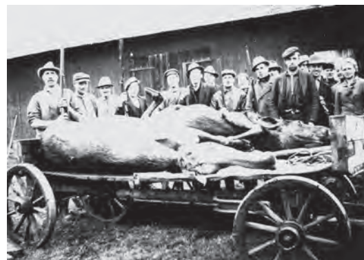
Jakten var länge en mer manlig värld. Här deltar trots allt en kvinna vid en lyckad jakt i Plombo, Stengårdshults socken. JLM.

Med den inriktning som föreliggande utredning haft har ovanstående underlag i form av inventeringar haft en mindre betydelse. I stället har betoning gjorts av möten i samtiden. Därför har det nu genomförda fältarbetet haft särskilt stor betydelse.