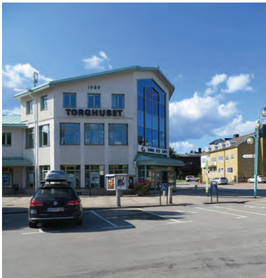
Torghuset i Smålandsstenar är en samlingsplats med bland annat biograf och turistbyrå.

Köpmannagatan åren 1920–1953. Husets revs 1953 och ersattes med Folkets Hus.