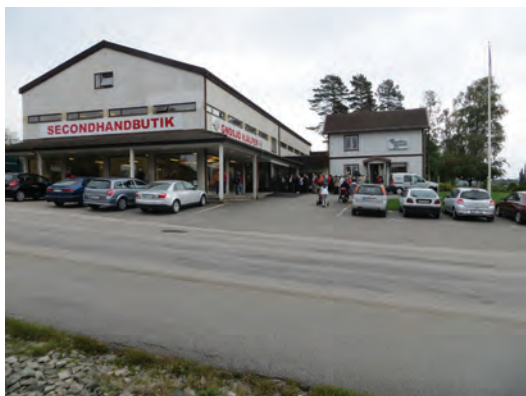
Ovan: Seconhandvaruhuset i Gnosjö som drivs av Gnosjö hjälper.

En kooperativ förening drev en affär i Marieholm. Den startade på 1920-talet och levde kvar till 1980-talet.