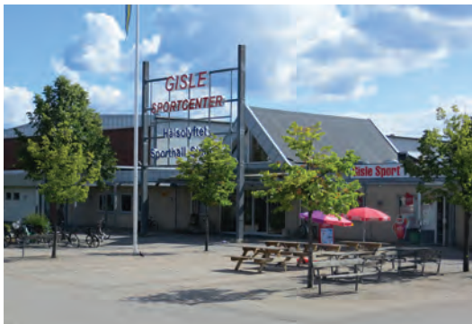
Ovan: Gisle sportcenter i Gislaved.