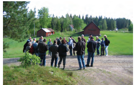
Hembygdsförbundet och läns museet håller i kursen "Lanskapets förändringar genom historiska kartor" för Gnosjö hembygd-förening.