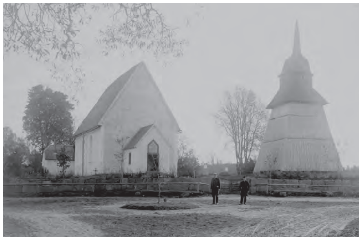
Att samlas på kyrkbacken var förr ett betydelsefullt sammanhang för möten och spridning av nyheter. Här har två sockenbor mötts utanför Våthults kyrka.

De mötesplatser som förknippas med statskyrkan, i dag Svenska kyrkan, tillhör de miljöer som kulturarvssektorn fokuserat på sedan mycket länge. Därför är dessa miljöer också väl identifierade och dokumenterade. Slutligen finns det en lång tradition att ge dessa miljöer ett starkt skydd. Av denna anledning har Svenska kyrkans miljöer inte prioriterats vid föreliggande kartläggning av människors mötesplatser.