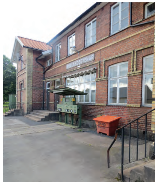
Ovan: Stationshuset i Smålandsstenar. Till vänster: Den första tågbiljetten i Gnosjö såldes i december 1902.

Redan under järnvägsepokens tidiga skede hade linjer invid Nissastigen diskuterats och på 1880-talet fanns spår från Halmstad via Värnamo och Vaggeryd till Nässjö. Vid sekelskiftet 1900 intensifierades arbetet med att försöka skapa en linje från Reftele till Gislaved och denna uppfördes 1899–1902. Järnvägen var betydelsefull för traktens industriella tillväxt och det var ingen slump att Gislaved erhöll municipalsamhällesstatus bara ett par år efter järnvägsinvigningen.