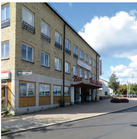
Ovan: Folkets hus i Gislaved.

Arbetarrörelsen i Gislaved manifesterade sin verksamhet genom att skapa mötesplatser för sina medlemmar. Folkets Park, vid Gröna vägen 39, bildades 1930 och här samarbetade man med nykterhetsrörelsen. Platsen hade redan tidigare en tradition att användas för utflykter, dans och samlingar och kallades då Slätterna. I folkparksmiljön ingår bland annat dansbana och utomhusscen, men området håller på att omdanas och utvecklas till Mötesplats Gisle, se särskilt avsnitt.