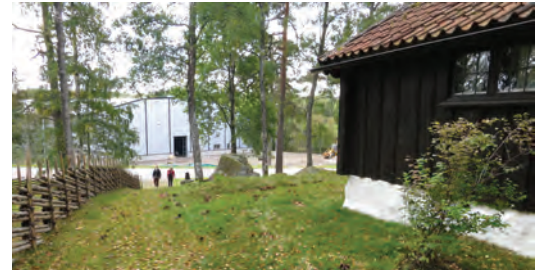
Nedan: I Burseryd ligger hembygdsgården och den nya multiarenan i Tyngelvi intill varandra.