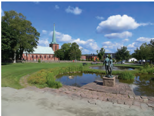
Svenska kyrkan är en av de väletablerade mötesplatserna, här kyrkan i Gislaved.