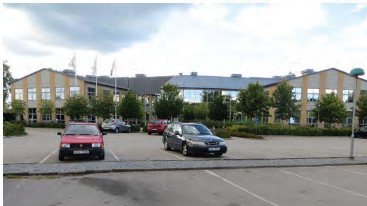
Gnosjöandans kunskapscentrum vid Töllstorp i Gnosjö.

En anläggning som spänner över flera områden är Mötesplats Gisle i den södra delen av Gislaved. Området ligger på historisk mark – här anlades Folkets park en gång i tiden. Sedan flera decennier finns här dessutom Gärdesskolan, ovan nämnda Lundåkersskolan i gult tegel, konsertsalen, Gisle sportcentrum, Gislerinken samt den delvis nybyggda Musikskolan. Utvecklingen av området pågår för fullt och här skapas också konsthall, ungdomshus samt lokaler för teater och dans. Verksamheter som traditionellt varit separerade kommer här att mötas invid varandra.