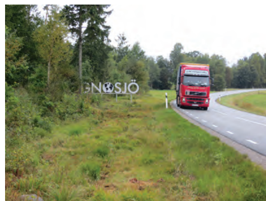
Både Gislaveds och Gnosjö kommuner har profilerat sig som företagsvänliga och entreprenörsinriktade.