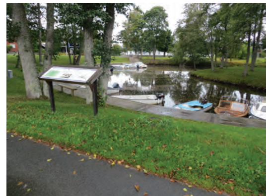
Hamnen i Hillerstorp har många kvaliteter och här arbetar Gnosjö kommun för att skapa en mötesplats. Informationsskyltar berättar om platsens historia.

Andra möten innebär att man träffar andra personer med helt andra erfarenheter och världsbild, vilket kan medföra att ens idéer om tillvaron ifrågasätts och utmanas. Sådana möten kan leda till att man, trots allt, kvarstår i sin uppfattning eller att man omprövar och modifierar sin syn på omvärlden. Deltagandet i olika mötessituationer medför ofta att man intar något olika roller eller agerar olika