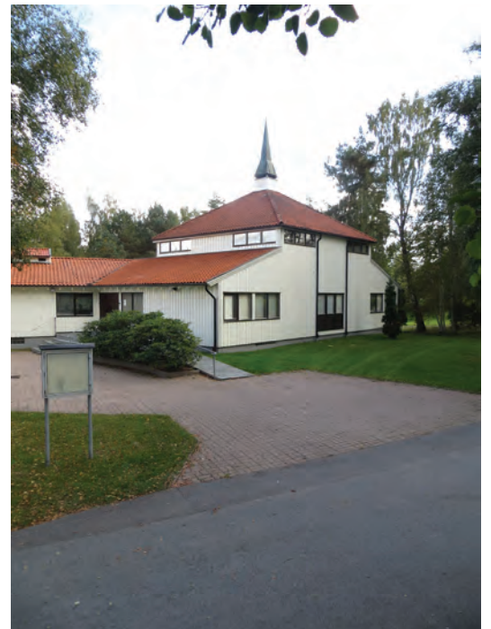
Allianskyrkan i Gislaved har nyligen konverterats till moské.

I dag finns det inget i det yttre som visar att byggnaden används som samlingsplats för den Bosnien-muslimska föreningen.