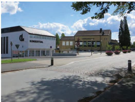
Nedan: Lundåkersskolan och konsertsalen i Gislaved.