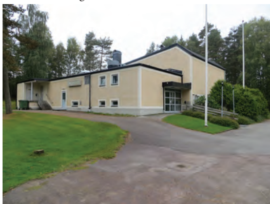
Nedan: Medborgarhuset i Hestra.