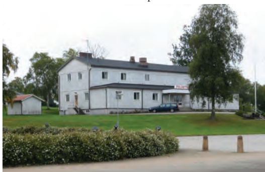
Nedan: Folkets hus i Anderstorp.