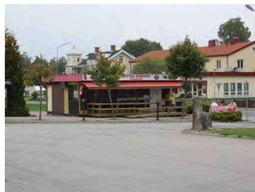
Området kring järnvägsstationen i Hestra är fortfarande en samlingsplats, här Hestrakiosken helt nära stationen och spårområdet.

Järnvägens betydelse har visserligen minskat vid en jämförelse med konkurrerande kommunikationsmedel, men trots detta har stationsmiljöerna ofta bibehållit en funktions som mötesplats i tätorter och småsamhällen.