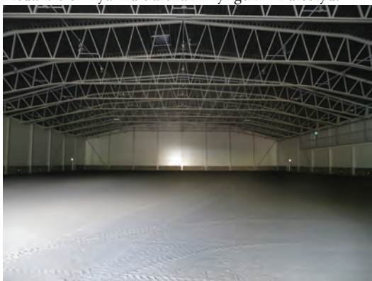
Nedan: Den nya multiarenan i Tyngelvi i Burseryd.