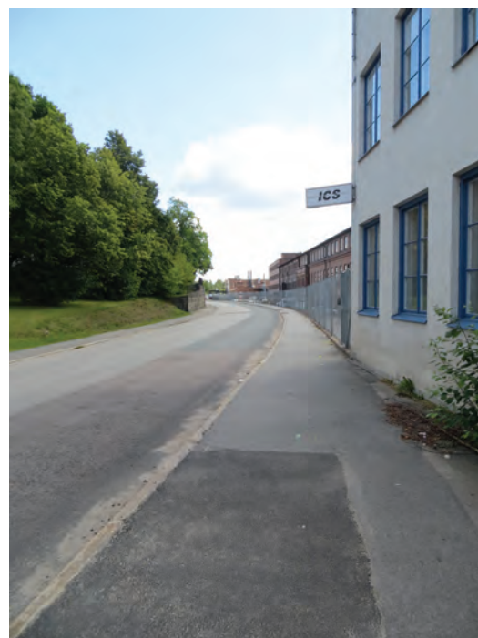
Kommunernas industrier har givit upphov till många sammanhang där de anställda mötts.

Både Gislaveds och Gnosjö kommuner har ett dynamiskt näringsliv där avknoppning och successiv framväxt är tydliga komponenter. Ibland blir det särskilt tydligt att ett företag etablerats i en liten verkstad på en ensamliggande gård och att företagets lokaler byggts ut efterhand så att den i dag står en stor fabriksbyggnad mitt i od-