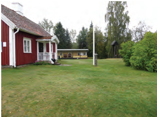
SMU Holmens sommarhem med det gamla torpet som kärna i anläggningen.

kommun och Bårebo missionshus (Gnosjö socken), Hädinge missionshus (Kävsjö socken), Norrebo missionshus (Gnosjö socken), Algustorps missionshus (Källeryds socken), Skärvhults sommarhem (Åsenhöga socken), Kulltorps missionskyrka (Kulltorps socken, i dag med annan funktion), Filadelfia i Hillerstorp (Kävsjö socken) och Pingstkyrkan i Gnosjö (Gnosjö socken) inom Gnosjö kommun. Urvalet speglar både olika samfundstillhörighet, skilda epoker och landsbygds- respektive tätortsmiljöer.