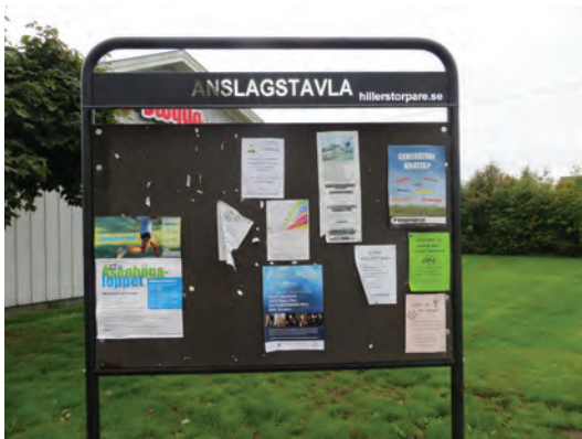
Information om arrangemang och mötesplatser kan ges genom informationstavlor som samhällsföreningarna ansvarar för.

inventeringsmomentet så lite som möjligt så att en fyllig brutto-förteckning över de påträffade mötesplatserna kunnat upprättas, men att fördjupningen inom de enskilda mötesplatserna sovrats hårt. Detta tillvägagångssätt skapar förutsättningar för att återuppta projektarbetet i efterföljande etapper.