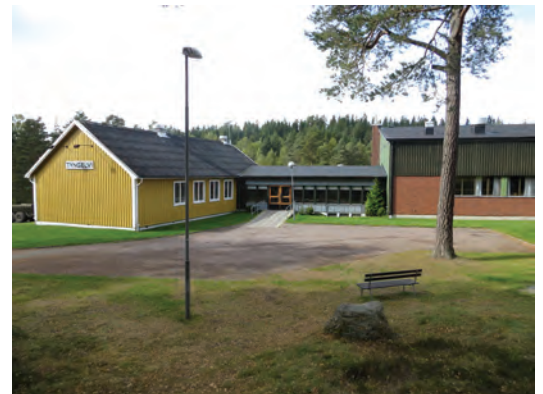
I Tyngelvi har man samlats flera gånger för LAN-parties.

LAN – Local Area Network – är en form av datorbaserat tillfälligt nätverk. Vid ett LAN-party kopplas flera datorer samman i ett nätverk och i regel spelar man dataspel mot varandra. Dreamhack i Jönköping är ett av världens största LAN-parties, men i Gislavedstrakten finns motsvarande aktiviteter, fast i mindre skala. Föreningen NitroXY arrangerar LAN-parties i Gislavedsområdet, vanligen två om året med plats för ett par hundra deltagare. Arrangemanget har flera gånger hållits i Tyngelvi, Burseryd. Förutom dataspel finns tävlingar då man exempelvis kan vinna titeln Mr. Nördig lanare.