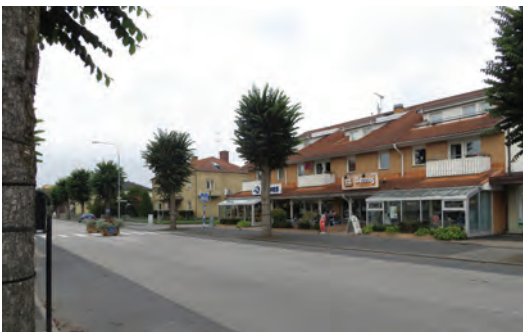
Anderstorp har ett ovanligt koncentrerat kommersiellt centrum i form av Storgatan. Detta medför att det blir en träffpunkt för många.

Anderstorp i Gislaveds kommun påminner i vissa avseenden om Hestra. Anderstorp har också en tydlig huvudgata där ortens mötesplatser koncentreras. Här utefter den allékantade Storgatan finns Bernts konditori, ICA Supermarket, Folkets hus, Hotell Åsen, småbutiker och Anderstorps kyrka längre österut.