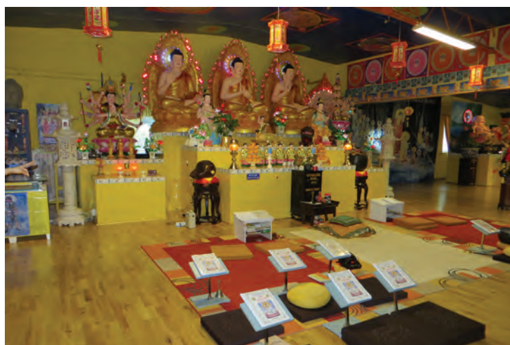
Buddhisttemplet i Gnosjö har lokaler både för religiös utövning (som här) och för andra former av samvaro.

En mer omfattande migration under senare decennier har medfört att andra religioner än kristendomen fått fäste i Gislaveds och Gnosjö kommuner. Inflyttningen från Vietnam och andra delar av