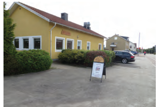
Ovan: I flera mindre orter finns restauranger, som här Buregården i Burseryd.