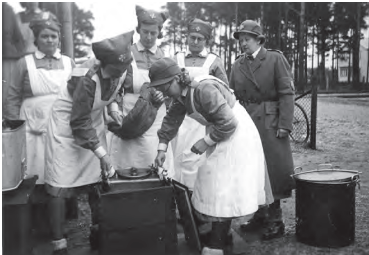
Under beredskapstiden var Lottakåren ett sammanhang som skapade gemenskap bland kvinnorna. Lottakurs i Gislaved. JLM.