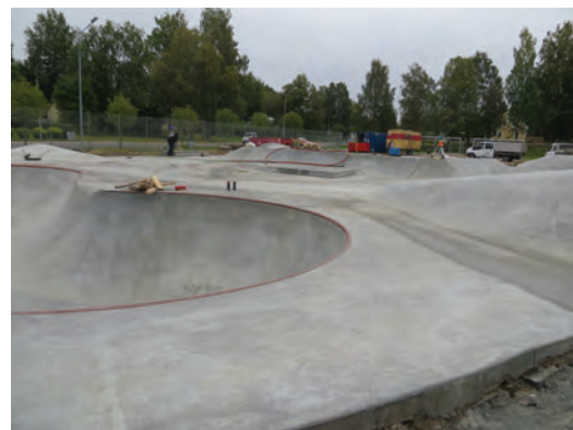
Den nya skate-parken i Gnosjö.

Motorsport är något som länge förknippats med Anderstorp i Gislaveds kommun. I dag heter anläggningen Anderstorp Raceway och fortfarande uppfyller banan höga krav från förarna med 8000