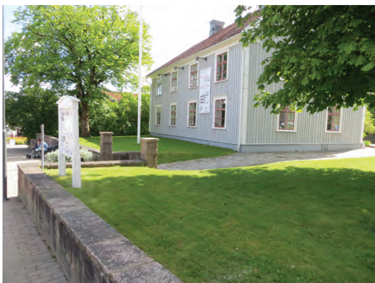
Till vänster: Köpmangatan var ett raggarstråk en gång i tiden och på muren satt man och betraktade ekipagen. Nedan: Hillerstorps Bilservice är fortfarande en spontan mötesplats för många.

Ett raggarstråk fanns i Gislaved och gick utefter Köpmangatan. Gislaveds konsthall, tidigare Kulturhuset Borgen har en mur mot gatan och på denna satt man gärna och betraktade raggarna.