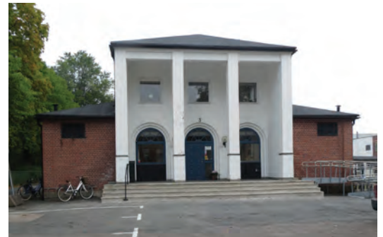
.Ringsalen som förknippas med Gummifabriken. Till vänster: I södra Gislaved ligger Lundåkersskolan och konsertsalen invid varandra.