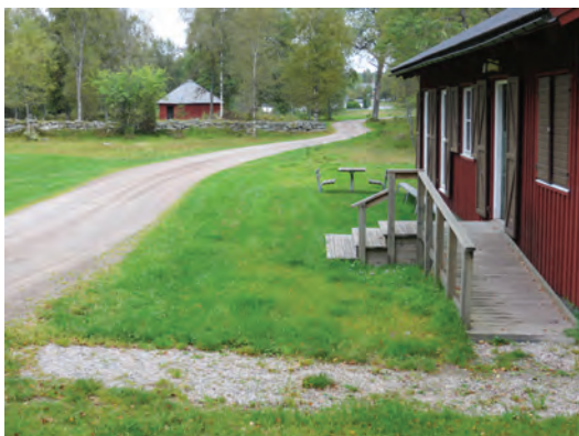
Hembygdsgården i Åsenhöga ligger helt nära ödekyrkogården och består både av äldre bebyggelse och en museibyggnad.

Hembygdsrörelsen har stor betydelse för att skapa och vidmakthålla kunskapen om närsamhällets historia. Många föreningar arbetar med bygdens framtid och fungerar som en samlande kraft i sina bygder. Hembygdsgården blir en viktig mötesplats i kommunen. Föreningen kan bedriva sitt arbete med kulturarvet med att förmedla den kunskapen genom traditioner och fester, stads- och byvandringar, kulturstigar, föreningsliv och gemenskap.