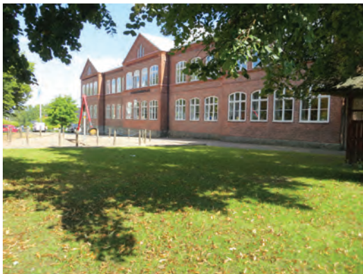
Ovan: Johan Orreskolan i Gislaved.