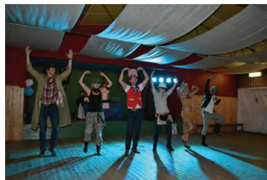
Möteslokaler finns det flera av på landsbygden. Festligheter på Pärlan i Källerstad. Foto Gislaveds kommun.

Den tydligaste avgränsningen inom projektet har sin utgångspunkt i projektets budget. Därför har målet varit att begränsa