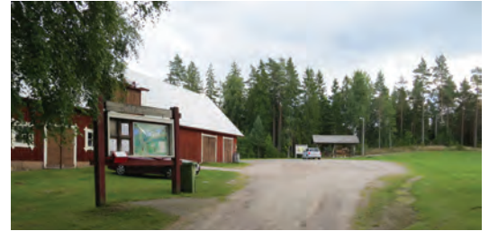
Ovan: Töllstorp förknippas i dag både med det omfattande industrimuseet och med sporthallen.