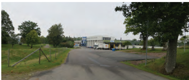
Troax AB i Tyngel har vuxit till en stor industri i det gamla odlingslandskapet.