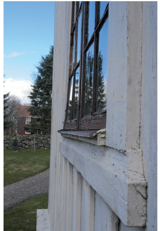
Ett av fönstrens ena bågsidostycken hade en kraftig deformation och böjde sig nederst. Denna båge skruvades fast i karmen för att minska på deformationen något.