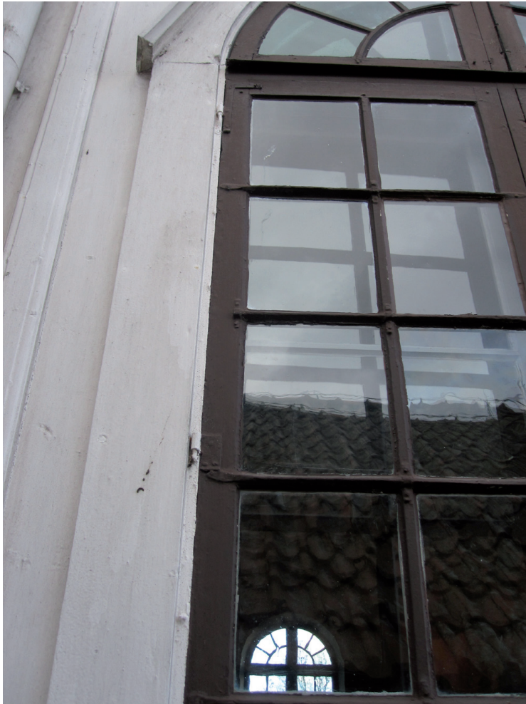
Detalj av fönster inför restaureringen. Lägg märke till tvärstagen som är inkittade tillsammans med spröjsen.