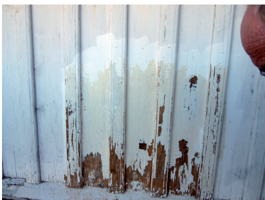
Inför målningsarbetena gjordes rengöringsprov. I programmet angavs rengöringsgrad 2, d.v.s. målet var att få bort alkydoljefärgsskiktet utan att skada varken linoljefärgsskikt eller trä.