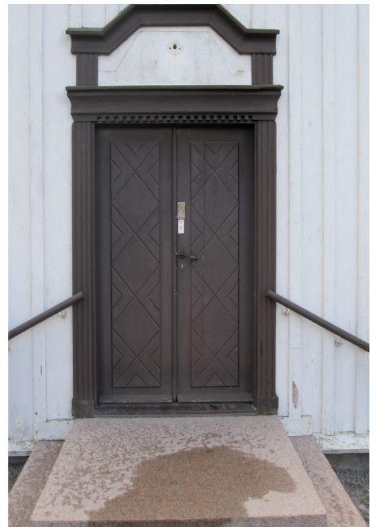
Entrépartiet inför restaureringen. Lägga märke till att panelen når helt ner till vattbrädan, vilket ändrades vid arbetena.