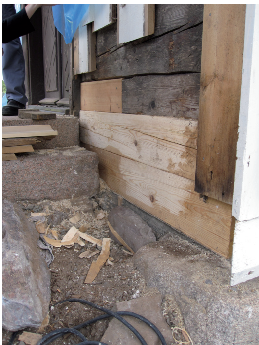
Rötskador vid sidan om vapenhusets entré lagades i med nytt virke ovanpå en betonggjutning nederst.