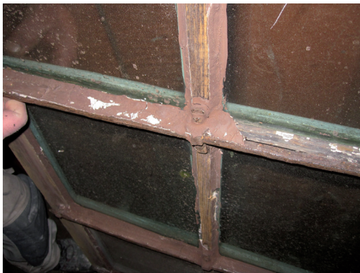
Här framgår att fönstrets tvärstag var ihopkittade med spröjsarna.