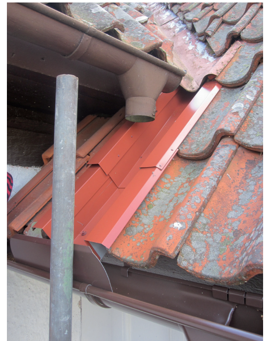
Vid rännaldalen mellan medeltidskyrkans långhus och nykyrkan ersattes en tegelrad med en plåt och ett översvämningsskydd på hängrännan för att förhindra vattenläckage.

Långhustakets halvvalmade takfall har två stuprör som båda leder ner i vapenhusets två hängrännor. För att vattnet från valmningen inte skall behöva ta vägen till vapenhusets norra hörn förlängdes stupröret i det nordöstra hörnet mellan långhuset och vapenhuset