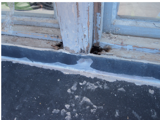
Rötskador på karmbottenstycke.