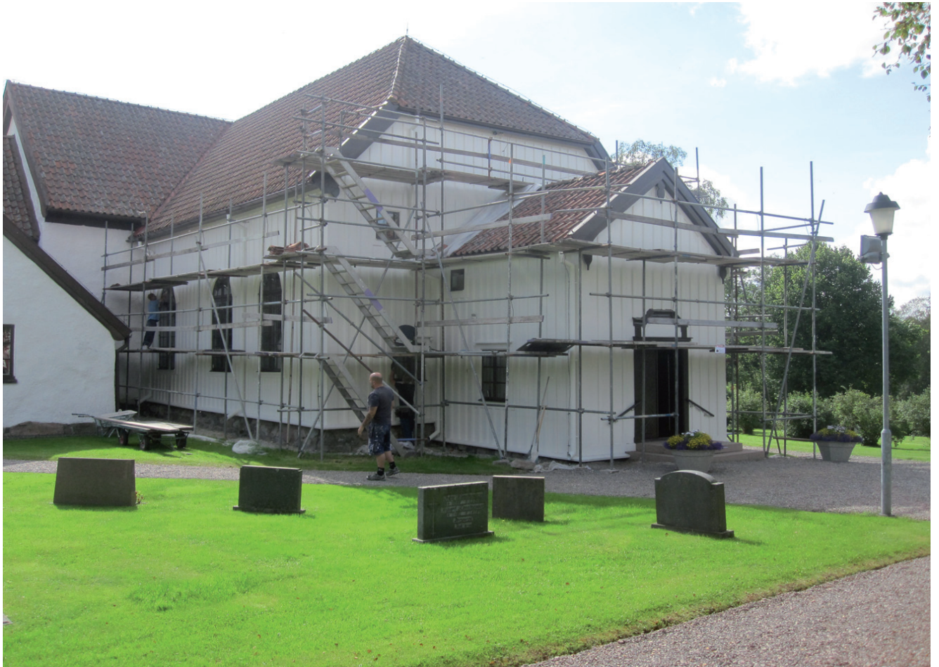
Nykyrkan efter ommålningen.