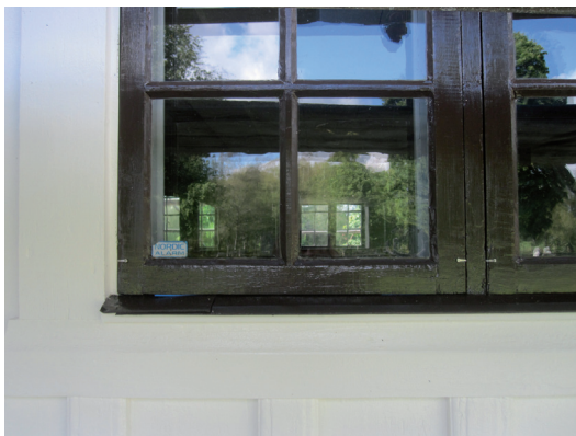
Detalj av fönster efter restaurering. Bågarna har fästs med hästkosöm som målades strax efter fotograferingstillfället.

övriga detaljers bruna kulör bibehållas. För att erhålla en så stor precision i kulörvalet som möjligt användes NCS-systemet. Fasadens två första strykningar gjordes med NCS S 0502-Y, men inför slutstrykningen justerades kulören något i riktning mot den vitare putskulören. Därför valdes kulören NCS S 0300-N.