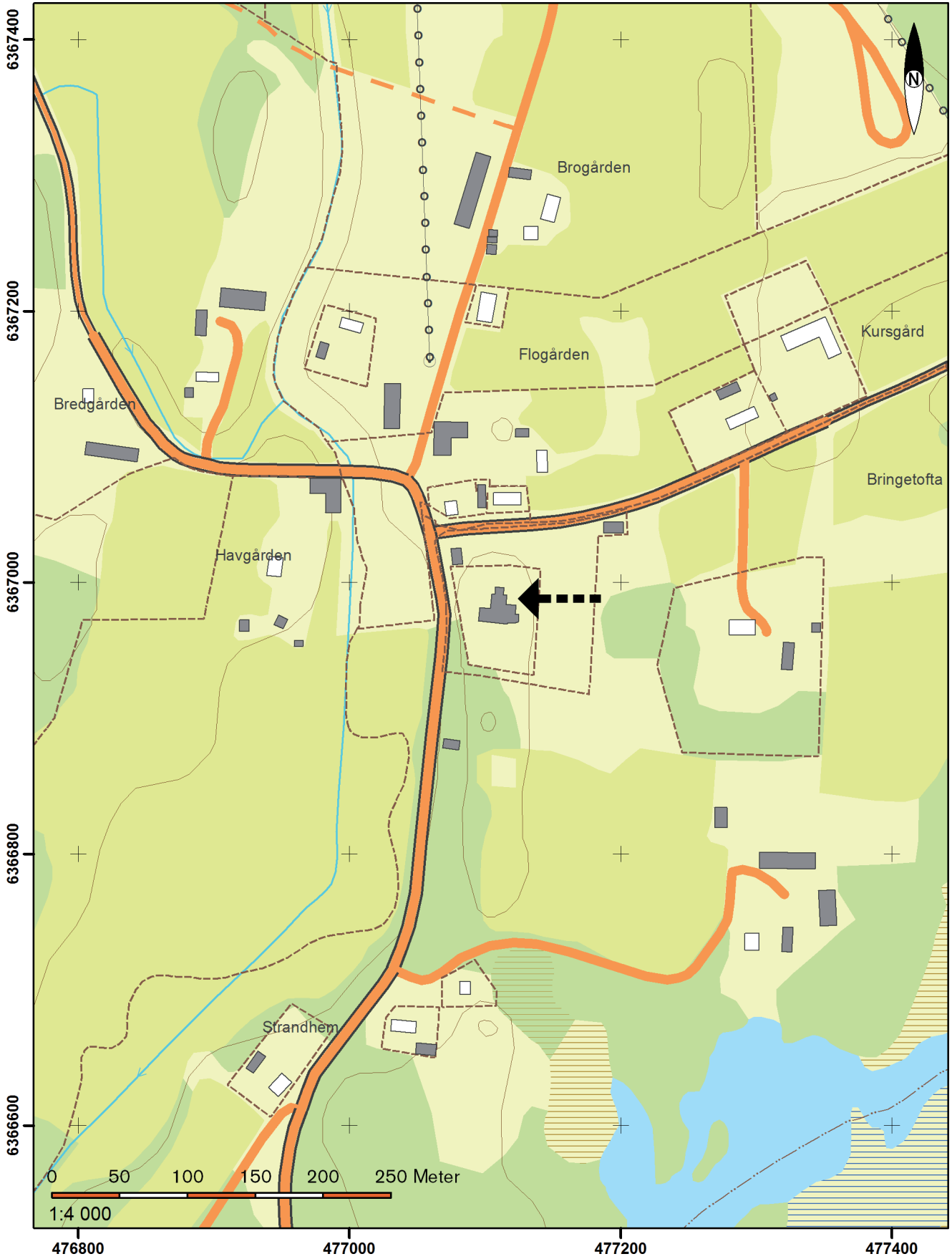
Utdrag ur digitala fastighetskartan.