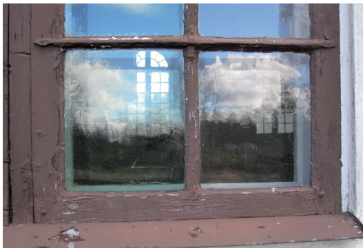
Detalj av fönster införarbetena. Bågen står på fönsterplåten, vilket kan leda till röta.