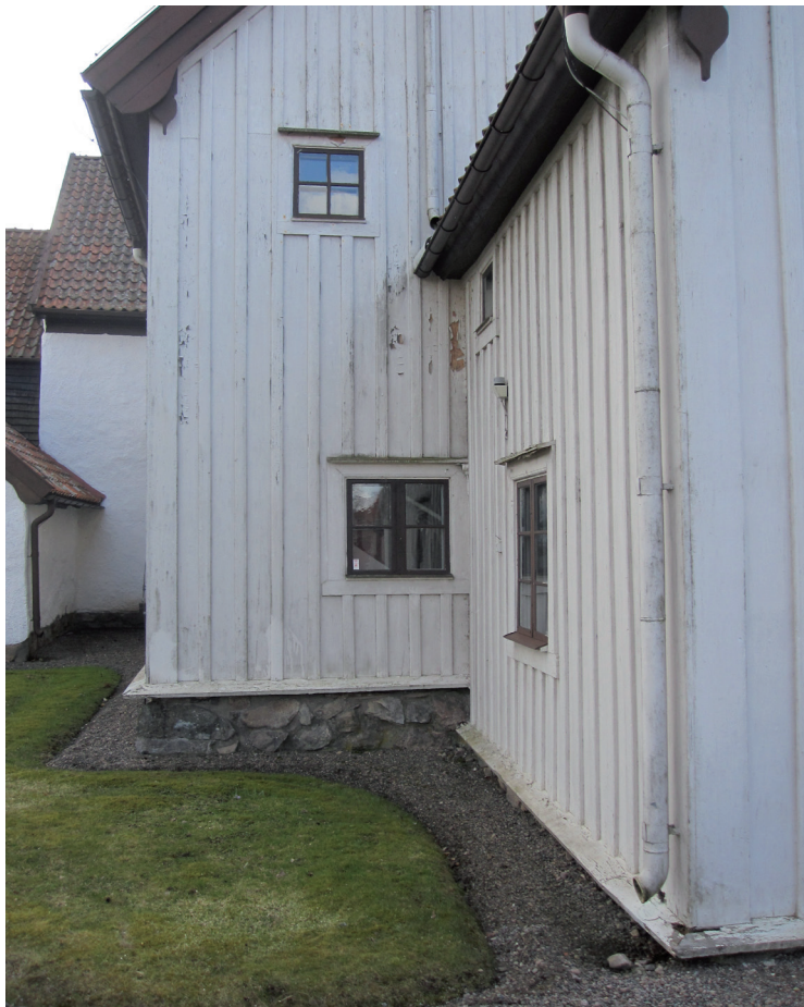
Trätillbyggnadens östra delar med den alkydoljefärgsmålade fasaden inför arbetena. Lägga bland annat märke till stupröret som mynnar ut på vapenhusets tak.

Syftet med den antikvariska medverkan var att bistå med råd och dokumentera vidtagna åtgärder. Antikvariska överväganden bedömdes bli begränsade eftersom målet inte var att förändra fasadens utformning.