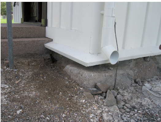
För att underlätta byte av fasadpanel om det stänker upp från trappan placerades en offerbräda ovanför vattbrädan.

så att det når ända ner till marken. Även tillbyggnadens stormlister var rötskadade och byttes ut.