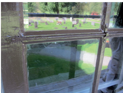
Detalj av fönster med stormstag efter restaurering.