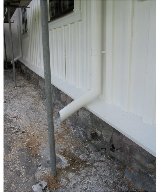
Stuprörens utkastare förlängdes.

Vid ommålningen eftersträvades ingen kulörändring, utan fasadens brutna vita kulör skulle även fortsättningsvis överensstämma med stenkyrkans fasadputs. Likaså skulle fönstrens, huvudentréns och