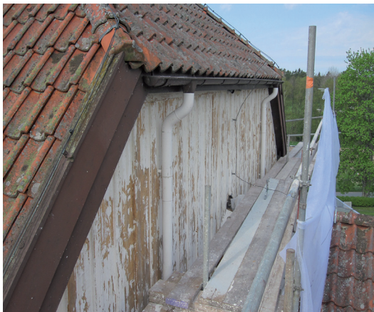
Nykyrkans gavel mot norr efter rengöringen.