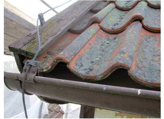
Ovan: Takfoten inför arbetena. Stormlisterna byttes ut mot nya lika de äldre.