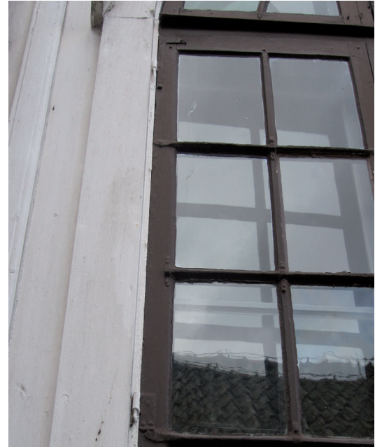
Detalj av fönster inför restaurering. Bågen står på fönsterplåten, vilket kan leda till röta