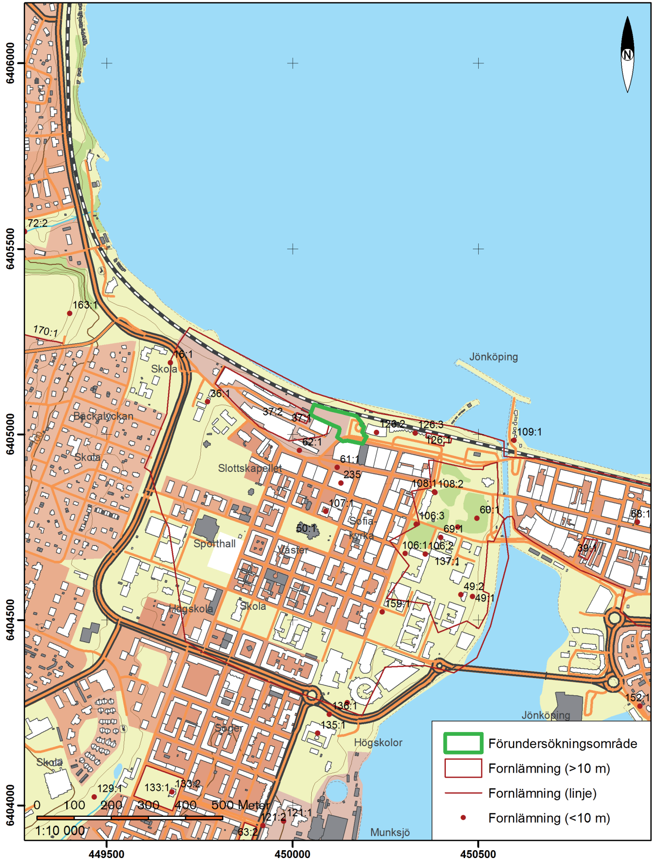
FIGUR 1. Karta över förundersökningsområdet markerat med grön linje. Skala 1:10 000.